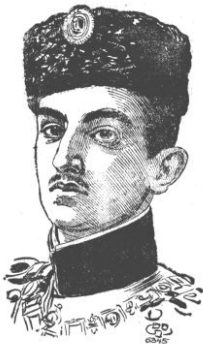
Srbski prestolonaslednik Aleksander, ki je nedavno težko zbolel na legarju, a se mu že obrača na boljše.