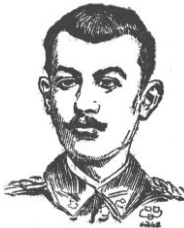
Luigi Luccheni, morilec avstrijske cesarice Elizabete, ki se je pred kratkim v ječi obesil.

Iz Središča nam poročajo: Vino letnika 1910 bode vsled lepega vremena pred in po tignavi jako dobro in bode glede kakovosti prekosilo celo letnik 1908. Priraslo ga je sicer malo in cena mu je zelo visoka. V ormoško-ljutomerskih goricah se plačuje sedaj mošt po 50—64 vin. Vsled silnega navala kupcev bo ves letošnji pridelek v kratkem času oddan.