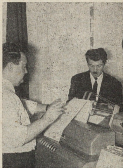
Strokovnjaka pri delu na tabelirki v IBM centru na Duplici

Z garnituro klasičnih strojev lahko obdelujemo podatke na način in v rokih, ki jih pri ročni obdelavi ni