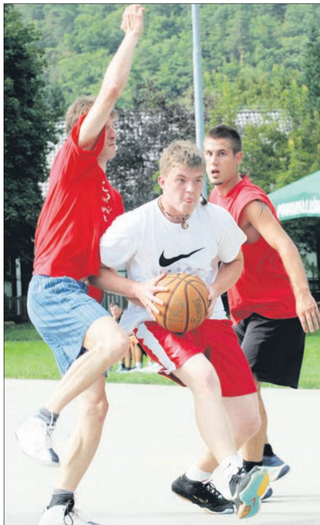
Zmagovalci košarke so bili fantje iz ekipe Duo mi trije, v nogometu pa je slavila Vigo avtovleka Sešl.