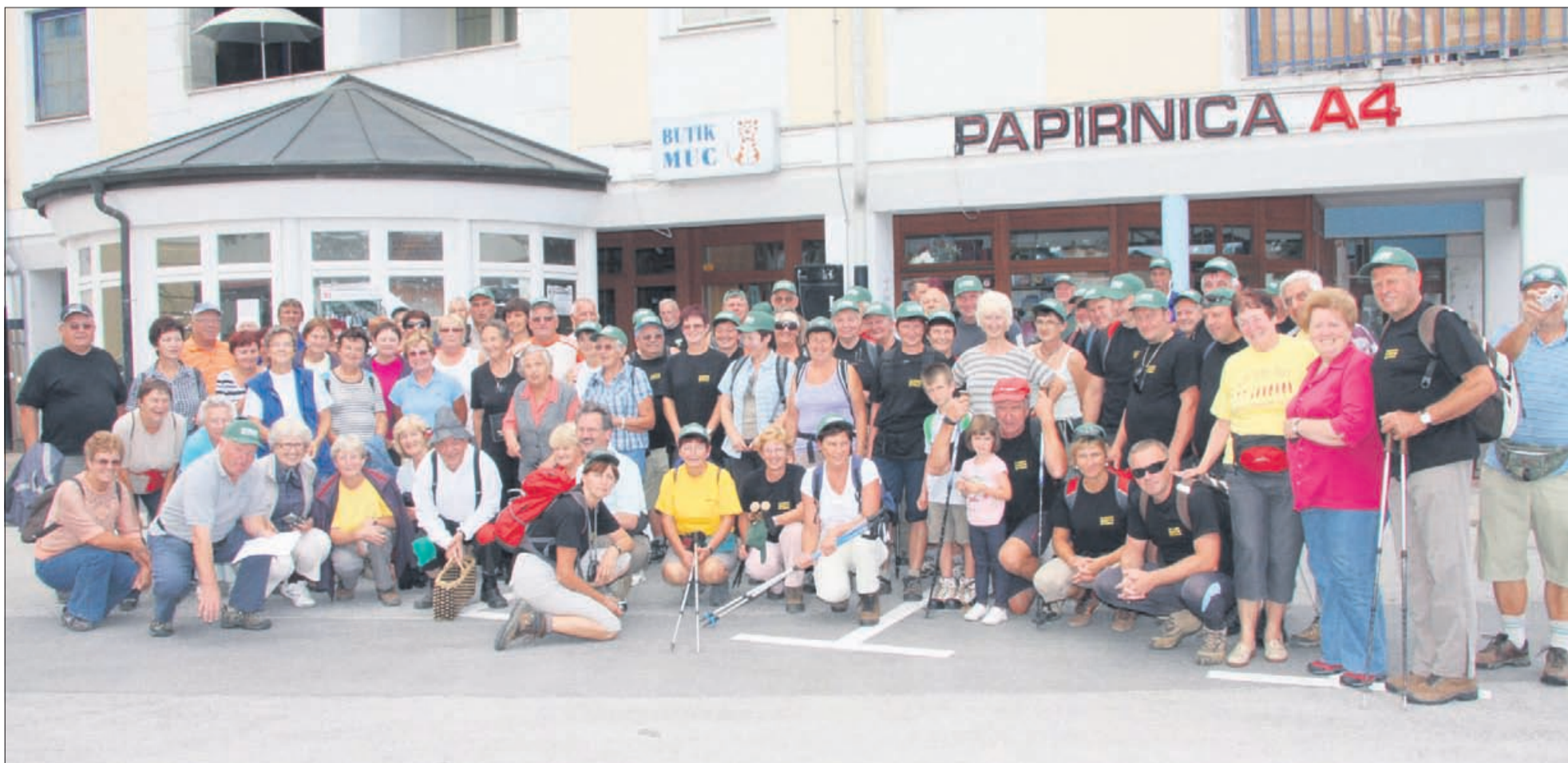
Lunohodci na Polzeli