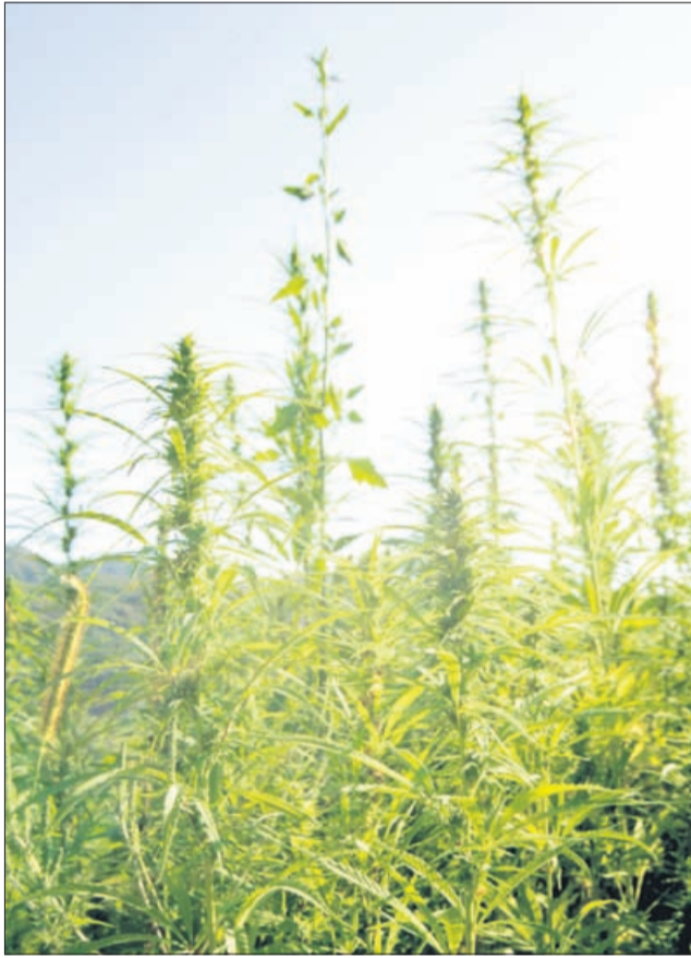
Na ekološki kmetiji Petek na Strmci se s pridelavo industrijske konoplje ukvarjajo že od leta 2004. Več o tem boste lahko prebrali v eni od prihodnjih števil Novega tednika.

Konoplja je v naših zakonih opredeljena z latinskim imenom cannabis sativa L. O tem, koliko vrst konoplje poznamo, se mnenja razlikujejo. Nekateri poudarjajo, da gre le za eno, drugi omenjajo tri najpogostejše: cannabis sativa , cannabis indica in cannabis ruderalis . C. indica in c. ruderalis imata višje vsebnosti THC od c. sativa, ki je sicer najbolj razširjena v Evropi. Razlik med industrijsko konopljo in prepovedano tako vsaj glede vrste ni, obstajajo pa različne sorte, ki se bistveno razlikujejo po vsebnosti THC. Industrijska mora imeti manj kot 0,2 odstotka THC v suhi snovi, medtem ko mora za učinek droge imeti konoplja vsaj 1 odstotek THC. Sicer naj bi za drogo uporabljali konopljo, ki ima od 5 do 20 odstotkov THC. Najbolj znane industrijske sorte konoplje so Novosadska konoplja, Beniko, Unico-B, med bolj znanimi sortami prepovedane konoplje pa so Spontanica, White widow, Skunk 1, Northern light.