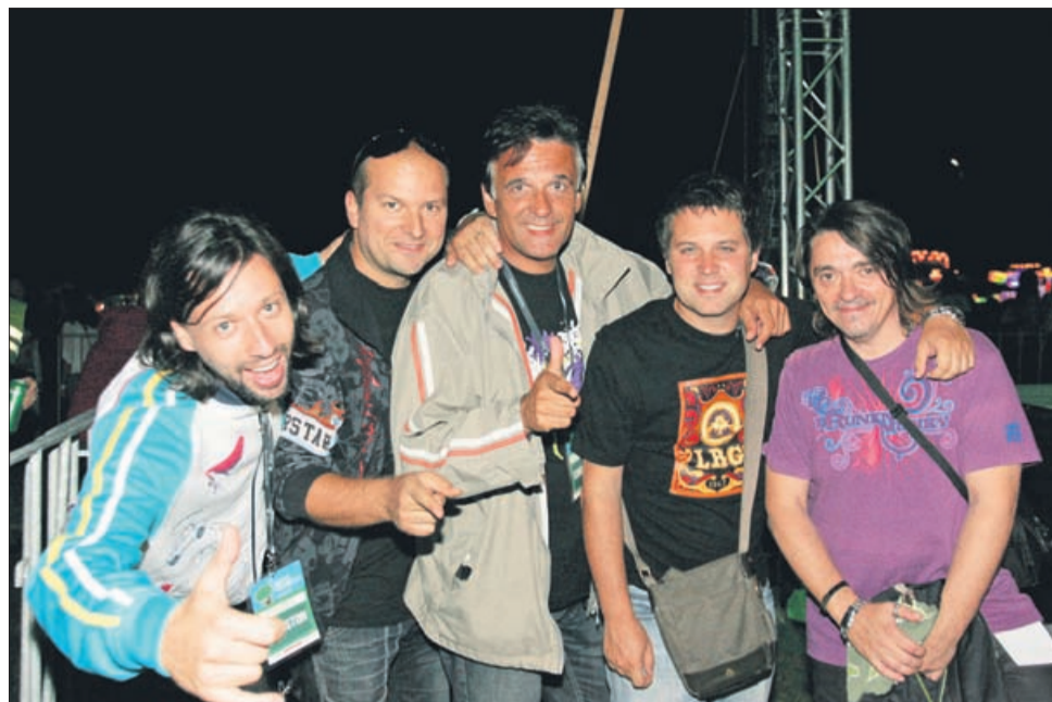
Dobro razpoloženi Kingstoni so bili osrednji gosti sobotnega dogajanja. Nastopili so v dveh delih.