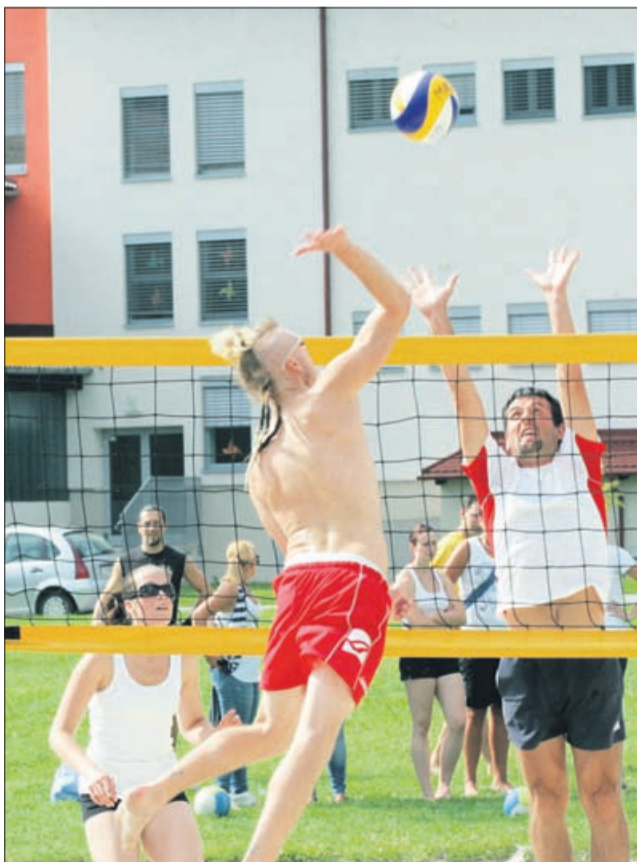
V odbojki na mivki, kjer so lahko tekmovalce mešane ekipe, so zmagale Jagode.