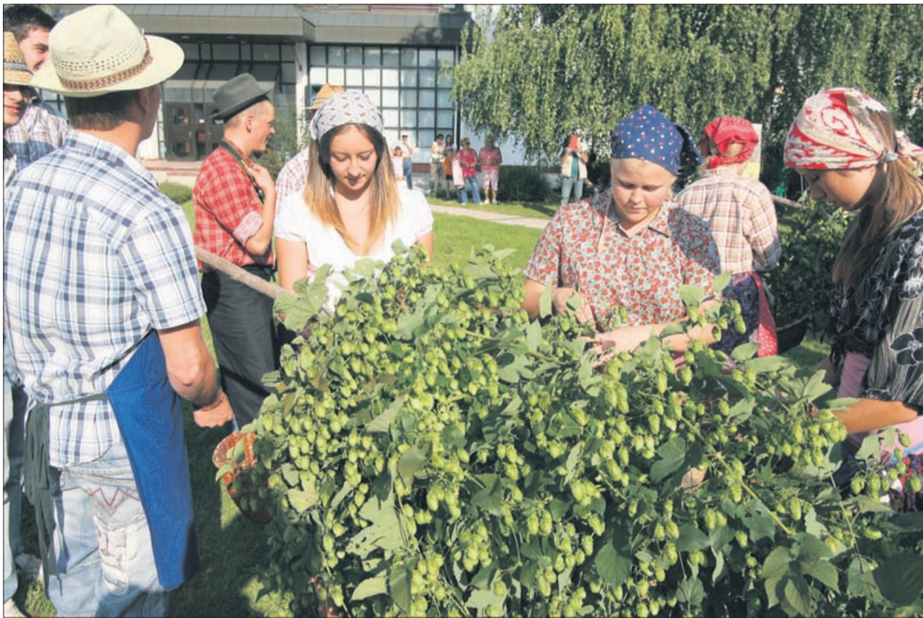
Kot v starih časih

Vendarle je bila sobota namenjena obiskovalcem, ki so pomagali potrgati dišeče kobule v nasadu pred žalskim hramom kulture. Na dan so privreli različni spomini, saj skoraj ni Savinčana z nekoliko višjim »emšom«, ki ne bo dodatnega denarja za nakup šolskih potrebščin ali sladoleda prisluzil ravno s polnjenjem škafov. »Vprašanje, če bi današnje »mladež« sploh spravili do hmeljišč,« se je slišal hehet med zagananimi delavkami. »Na srečo se danes ni treba več tako truditi,« je oporekala druga, ki je sveže utrغانo kobulo prvič v življenju zmlela med