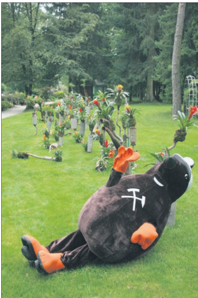
Izpušne cevi v funkciji vaz

V okviru razstave, ki bo na ogled do 21. avgusta, si lahko obiskovalci ogledajo še veliko razstavo kač strupenjač, ob koncih tedna pa šov pitonov.