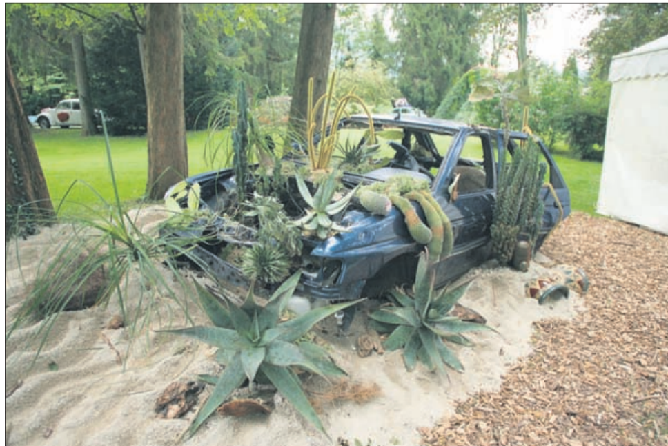
Puščavski videz polepša pločevino.