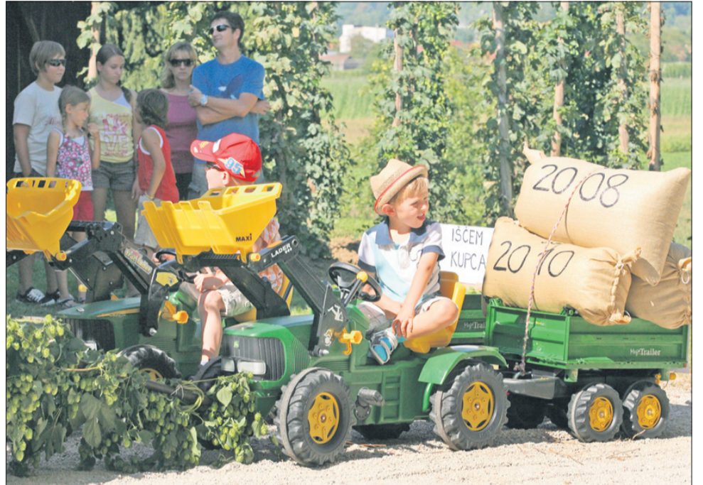
Najmlajši hmeljarji so prihajali iz Malih Braslovč.