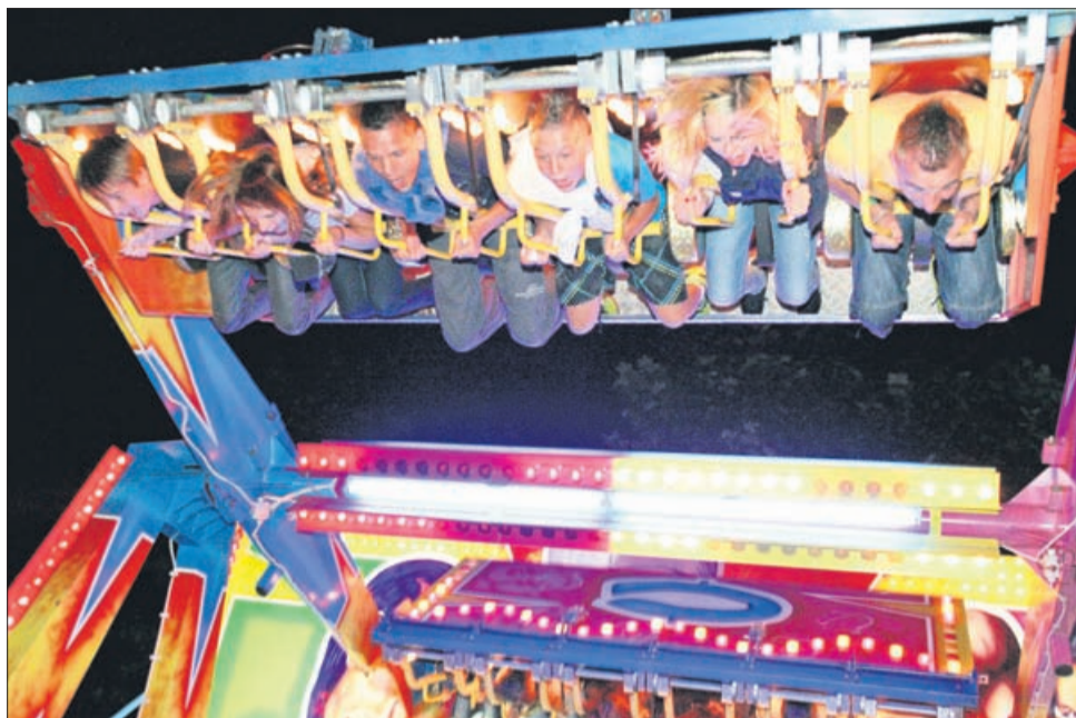
Obiskovalci so se lahko zabavali tudi v lunaparku.