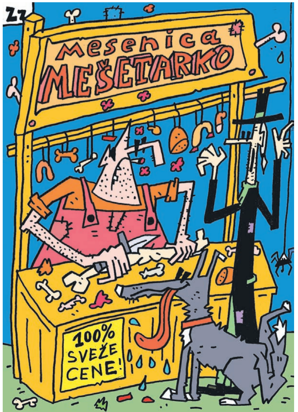
Avtor: Dalibor Bori Zupančič

»Hmeljarstvo je vedno doživljalo vzpone in padce. Trenutno padamo, izboljšanja pa ni na vidiku. Odkupne cene hmelja so nesramne. Tudi pri nas, kjer hmelj pridelujemo na 13 hektarjih, imamo doma še zaloge iz prejšnjih let. Nekaj smo ga sicer prodali, za kilogram pa dobili 90 centov. Ob tem je treba vedeti, da je 5 evrov za kilogram tista cena, ki pokrije vse stroške pridelave. Tisti, ki so sklenili pogodbe, so dobili hmelj plačan po 3,5 evra. Veliko hmeljarjev je odnehalo, nekateri pa še silimo in trenutno mečemo hmelj ven. Pravijo, da je treba v slabih letih star hmelj, ki se izrodi, metati ven in saditi novega. Želimo si dobro letino, hkrati pa, da bi bilo drugje slabše, da bi jo mi lahko prodali. Seveda upamo na boljše čase, da ne bi preveč hmeljarjev »scagal«.«