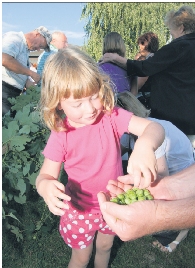
Prvi okusi hmeljeve grenkobe