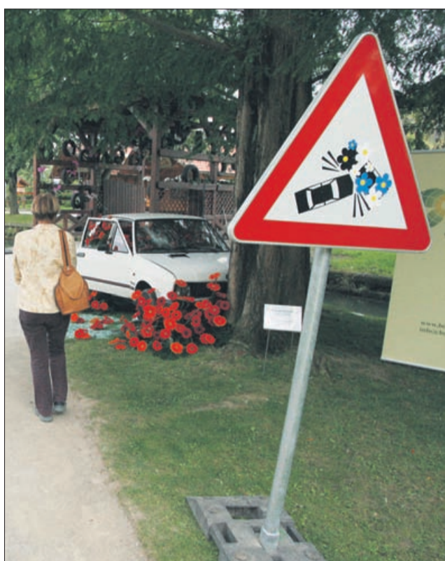
Imenitna dekoracija odsluženega avtomobila.

V okviru razstave, ki bo na ogled do 21. avgusta, si lahko obiskovalci ogledajo še veliko razstavo kač strupenjač, ob koncih tedna pa šov pitonov.