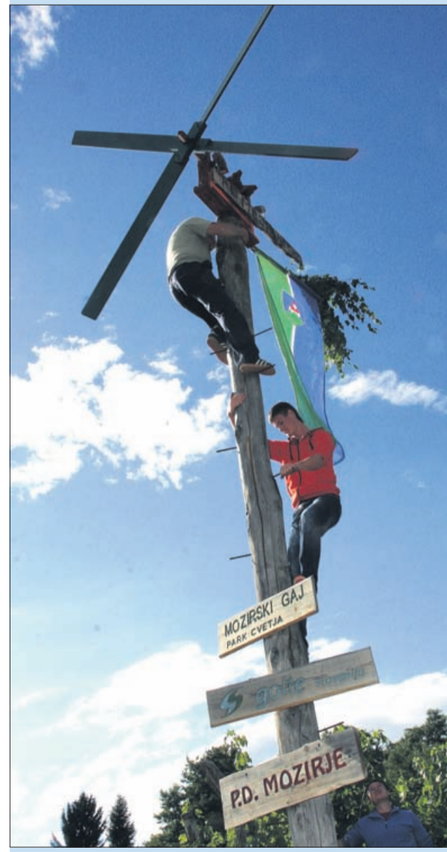
Klopotec bo preganjal škorce in druge »tiče«.