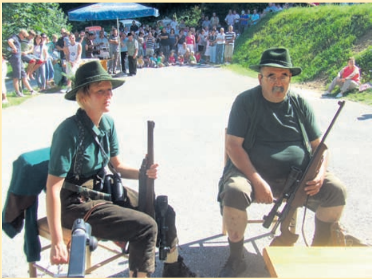
Krivolovka z rabljem pred sodiščem

V Lučah se je, nekoliko s težavami sicer, odvrtil 42. Lučki dan. Mogoče bi lahko rekli kakšno pikro, vendar vse bolj postaja očitno, da je tovrstno dogajanje v prvi vrsti namenjeno domačinom.