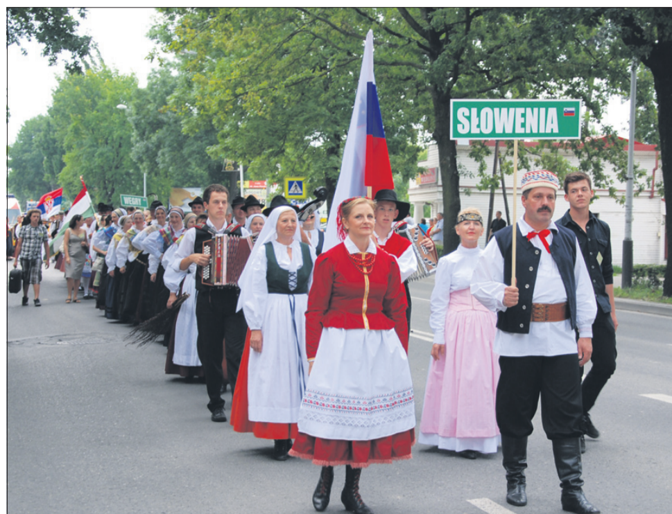
Šempetska FS Grifon v paradi