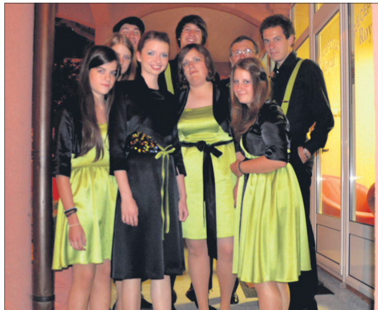
Skupinski posnetek Petrovih tamburašev