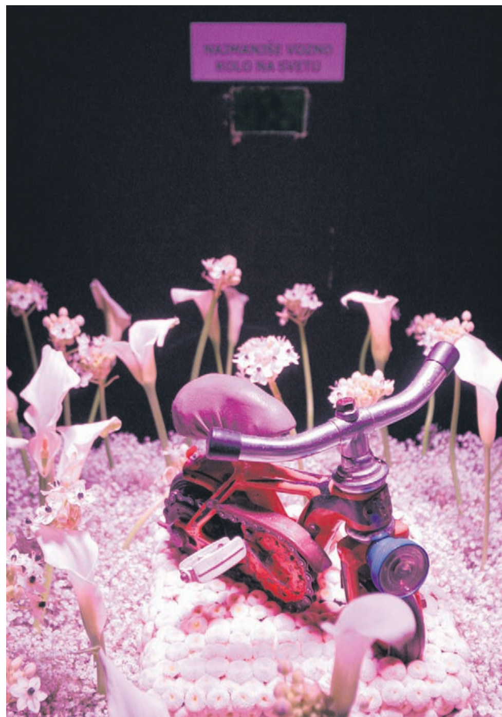
»Poročni paviljon bo tokrat skrivnosten. Na videz skrito, osvetljeno in kot kronski dragulji na posebnem piedestalu bo predstavljeno presenečenje, vidno skozi majhno odprtino.« Na, pa smo s fotografijo razkrili, kaj se skriva v poročnem paviljonu.

Odzivi med obiskovalci so bili že v sobotnem poznem popoldnevu zelo različni: »Slišali smo že tudi kritike, češ kaj vse je po novem v gaju. Vendar je bil to naš cilj: da ljudje opazijo odpadke, da se zavedo, da če že narava »okrasit« rjo, jo znajo slovenski vrtnarji in cvetličarji še bolje, hkrati pa da se vsaj kdo od obiskovalcev znova zave, da odpadki v resnici ne sodijo v naravo. Sicer je ob raz-