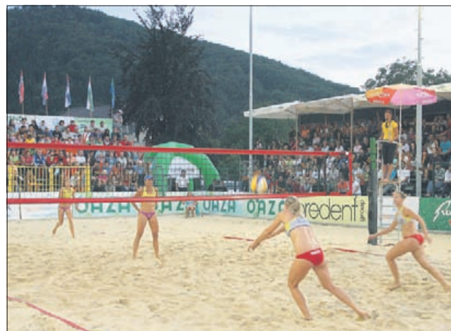
Atraktivne poteze pred polnimi tribunami

S sobotnima finalnima obračunoma na Oazi Mozirje Open se je končala letošnja serija turnirjev v odbojki na mivki Slovenian Beach Tour.