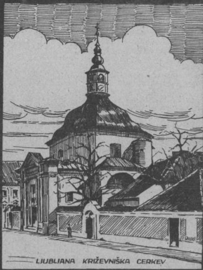
LJUBLIANA KRIŽEVNIŠKA CERKEV