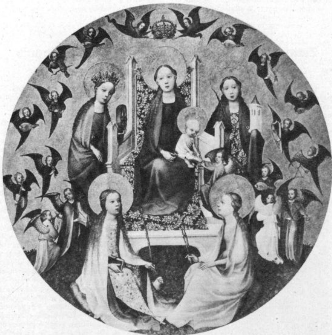
Kraljica angelov in svetnikov.

pomagajo, da se tudi v ubožnih cerkvah z vso dostojnostjo obhaja božja služba, da ima Zveličar v vseh cerkvah primerno bivališče. Mnogi udje in drugi dobrotniki pa pošiljajo bratovščini še posebne prispevke,