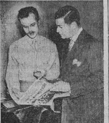
Ameriška armada v Evropi je dobila te dni svoje glasilo, ko so pričeli izdajati list "Yank." Na sliki sta urednika tega novega lista.

prehrani. V Sarajevu se je moglo dobiti dobro kosilo samo v hotelu. Toda že v Mostarju ni bilo niti kruha, vse, kar se je moglo dobiti, je bil slab kolač. V Dubrovniku so bile na razpolago same fige in zelje. Hercegovina, ki ni bila nikoli v stanju, da se sama prehrani, mora sedaj hraniti še begunce in vojsko."