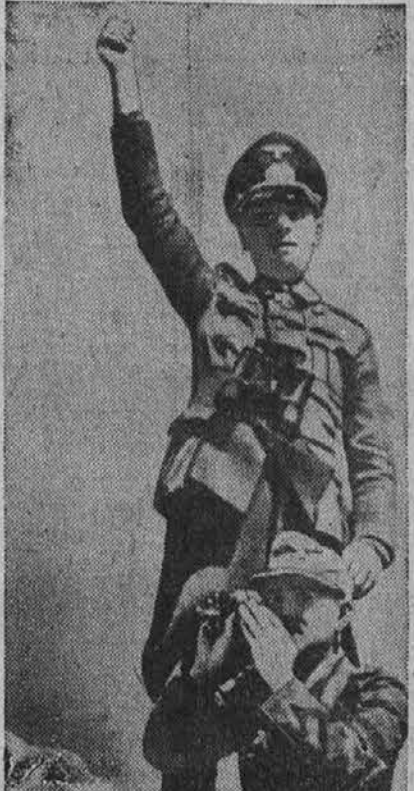
Na sliki je nemški maršal Rommel, stoječ na nekem tanku, odkoder poveljuje svojim četam v Egiptu.

V Egiptu pa napadajo Angleži Nemce in Italijane na vsej 40 milj dolgi fronti.