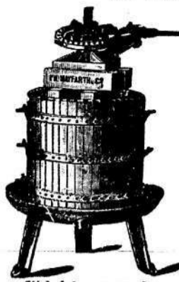
Stiskalnica za grozdje.

najnovejšega in najboljšega se stava z dvojno in nepretrgano priitiskalno močjo; zajamčeno najboljšo delovanje, ki prekaša vse druge stiskalnice.