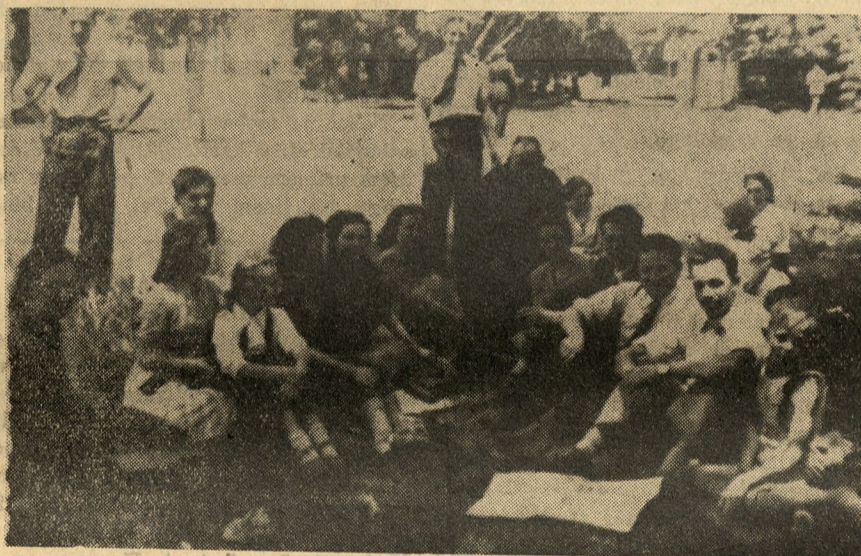
Prav prijetno je bilo v nedeljo 15. januarja v San Antonio de Padua. Po cerkvenem opravilu so slovenski izletniki prebili več ur ob veselem kramljanju v hladni senci.