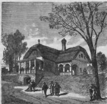
Ogerska krčma ali „esárda.“

Po vaséh so krčme mnogo priprostejše nego po mestih in trgih. Tu se krčmar ne pečá samó s postrežbo v njegovo hišo dohajajočih gostov, marveč tudi s kakim drugim obrtom, poljedelstvom in živinorejo. Mnogo krčmarjev na kmetih je tudi trgovcev, rokodelcev itd., kar je po vsem naravno, ker o samih svojih gostih bi se ne mogli preživeti. V krčmi na kmetih tudi ne more vsak gost zahtevati zase posebne sobe, kajti vsak, kdor v tako krčmo pride, najde le jedno samo sobo, v katerej