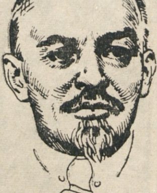
Včeraj je poteka 83 let, odkar se je rodil Vladimir Ilič Lenin, veliki voditelj ruske proletariata, tvorec oktobrske revolucije in genialni nadaljevalec znanstvene misli Marxa in Engelsa.

Komaj se je posušilo črnilo podpisov v letniku „Zvezne odelke ZVU“ na dovolilnici s katero sta odšla preko študentskega bloka v varno zavetje zaščitene starega in novega fašizma oba MSI-jevca, za katera najbrž ni bilo težko dokazati, da sta bila krivca na eksplozije bombe 8. marca na Korzu, že smo prejeli poročilo, da je isti načelnik pravnega oddelka ZVU podpisal ukrep o zmanjšanju kazni vsem ostalim fašistom iz Italije, ki jih je bilo zavezniško vojaško sodišče obsodilo zaradi udeležbe na nedovoljenih demonstracijah istega 8. marca. Znižanje kazni je tako znatno da kaznovani fašisti lahko že na prste štejemo dneve, ko bodo že zopet na svobodi, ko bodo torej že zopet lahko prihajali bombe v naše mesto in jih v imenu Tržačanov, ki baje tako zelo želijo Italije, metali med mirne meščane. Saj se bodo za-