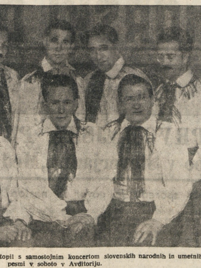
«Slovenski oktet», ki bo nastopil s samostojnim koncertom slovenskih narodnih in umetnih pesmi v soboto v Avditoriju.

Da ne boš komu prste siloval, je rekel barin, ko so se začeli podvodni udarci. Vlečem ga, bratec! Ne previrajte se... Stojte! Vlečem ga! Na gladini se pokaže velika somova glava, za njo pa črn, več kot meter dolg trup. Som obupno udara z repom in se poskusa izviti obhujmu. Ne brcaj, konec je muzike, bratec! Konec je s teboj! Ahah! Po vseh obrazih se razliva meden nasmeh. Nekaj časa ga molče gledajo. Velik som! Zajecja je šel in se poprasil po prsim. Pri bogu, pet kit bo imela. Mha... se strinja barin. Aja se mu vsa napevja. Ves se nekam napevja. A... ah! Nenadoma je som z repom silovito zamahnil, ribič se zadržal pljus, zadržal roke, toda bilo je prepozno; som je bil že bogve kej!