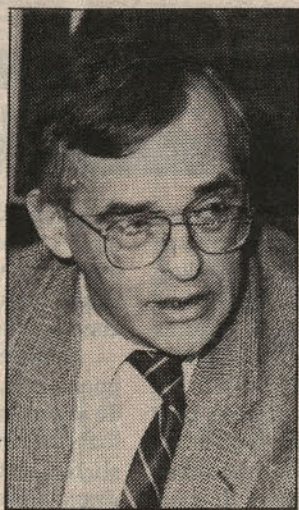
DR. ANDREJ CAPUDER Univerzitetni profesor, bivši minister za kulturo RS, član sveta SKD