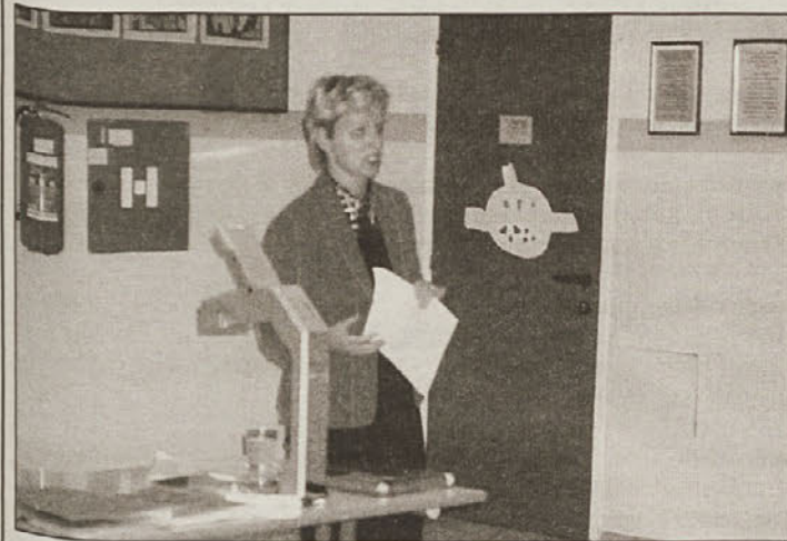
Ups, delo kriminalistke Sonje Molan je kar zahtevno.