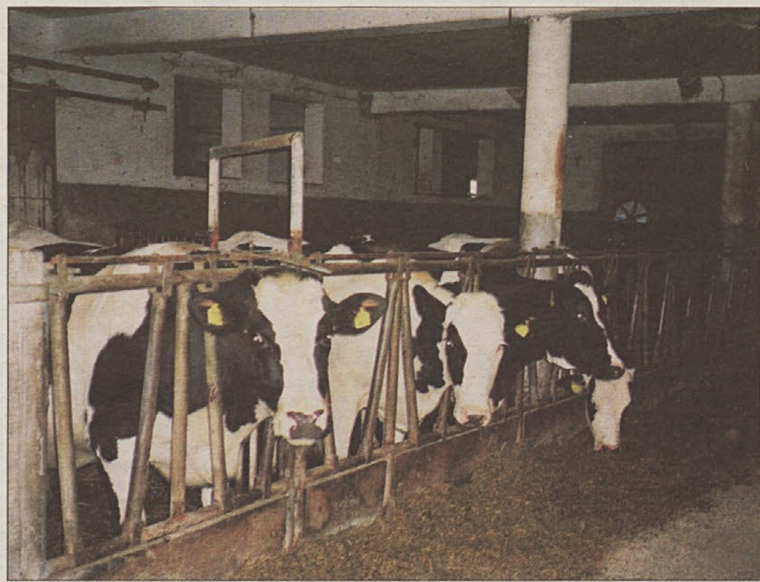
Kaj bi rekle krave, koga bi obtožile, če bi znale govoriti?

Zdaj so omenjene mlečne proge že odprte, vendar pa ima 117 osumljenih kršiteljev, od tega jih je bilo iz Posavja več kot 40, začasno prepoved oddaje mleka. Veterinarska uprava je do vključno ponedeljka že prejela približno 40 rezultatov testov iz referenč-