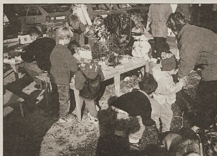
Malčki pri svojem “jesenskem” opravilu