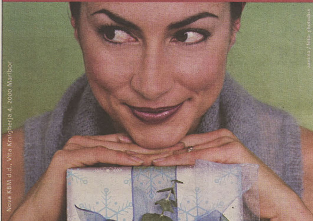
Nova KBM d.d., Vita Kraigherja 4, 2000 Maribor