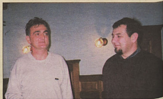
Kmečke dobrote iz Slovenske ljudske stranke: JANC z OCVRKOM

Tudi domači gostinci pomagajo pri posavski vinski krizi, saj gostinec pri blagovnici v Brežicah še naprej veselo toči vipavsko vino, na Dvorcu pa so se odločili za reklamo metliškega vina. Ali pa so morda krivi pivci, ki jim je tuje vino bolj modno!