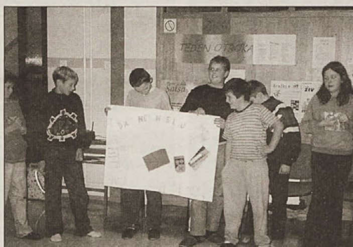
To smo mi - učenci 5. razreda

V četrtek zjutraj smo imeli prijetne urice z vrhunskimi športni-