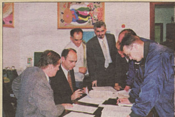
Člane OVK čaka še eno štetje.