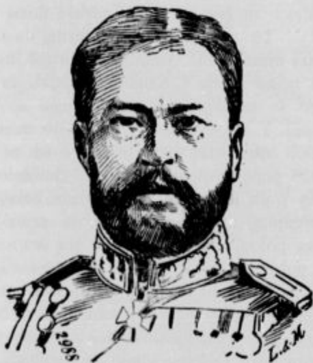
Japonski pomorski minister admiral Jamamoto.

† Župnik Voglar še zdaj nima spomenika na sodraškem pokopališču. Hvalevredno je županstvo sodraško, ki je sklenilo pobirati v ta namen. Saj je pa tudi potrebno,