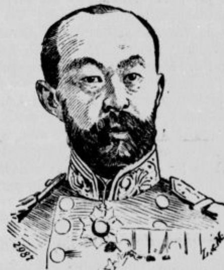
Podadmiral Togo, ki je napadel rusko brodogve pri Port Arturju.

nevihta z gromom, nalivom in snegom. Pobelilo je vse gore nad 700 m. Skazal se je spet sloveči petelin na Št. Jurskem zvoniku kot dober prerok. Gledal je v nedeljo na Polšnik: dež bo. Potem na Dole: kmalu bo dež. V pondeljek se je obrnil na Svibno: nevihta. In res je bila. Tujci, pridite gledat tega petelina!