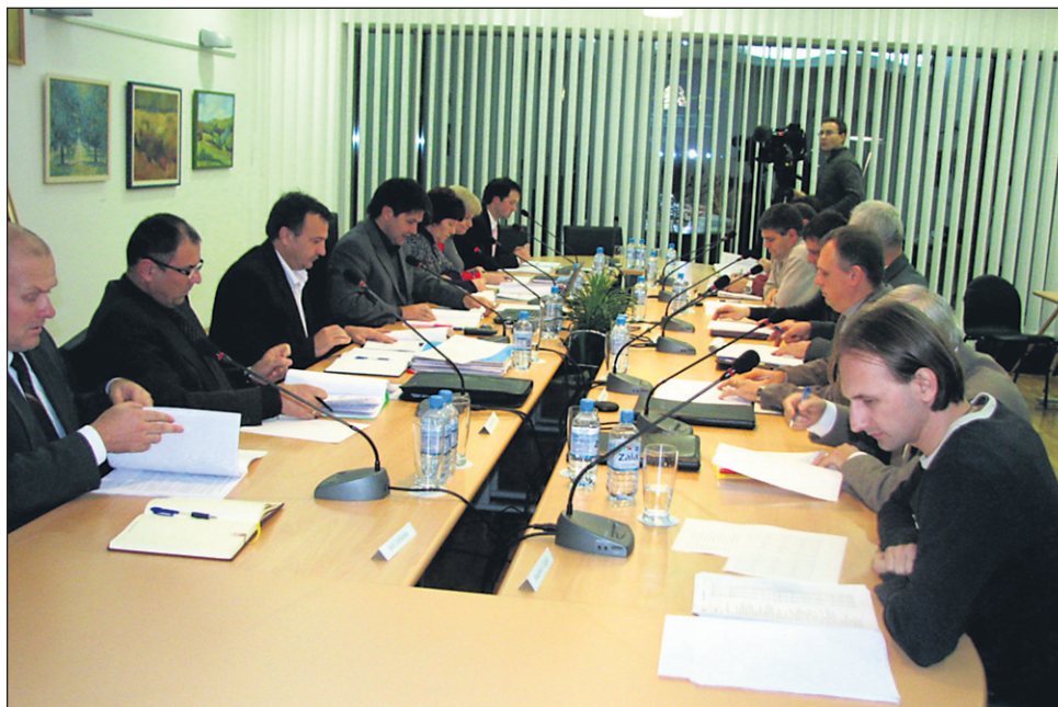
Dornavski občinski svet je z večino glasov potrdil rebalans proračuna 2011, župan pa je svetnikom povedal, da proračuna za leto 2012 ni uspel pripraviti, ker se je občinska uprava zadnji mesec ukvarjala s kriminalistično policijo, ki je preiskovala posle občine od leta 2008 naprej ...

Potem je župan občinskemu svetu podal informacije o letošnjih občinskih naložbah: „Kot veste, smo bili že lani uspešni na razpisu za Južno mejo s projektom modernizacije štirih daljših cestnih odsekov. Enega smo realizirali lani, ker pa so bile potem volitve in zima, sem se odločil, da bomo tri preostale rešili letos. Tako smo skupaj preplastili in razširili 6,2 kilometra cest, za kar smo po razpisu prejeli 425.451 evrov iz državne in evropske blagajne, sami pa smo morali dodati nekaj manj kot 92.000 evrov. Nadalje smo asfaltirali še tri krajše odseke cest, za kar smo porabili denar, ki ga občina dobi iz državnega proračuna (23. člen zakona o financiranju občin). Gre za odseke Strmec pri Polenšaku, Prerad in cesto v Hrgov klanec. Skupno je bilo asfaltiranih 1,1 kilome-