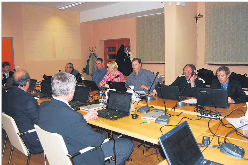
Svetniki so rebalans proračuna sprejeli, kljub temu da ga štirje svetniki niso želeli potrditi.

A seja je postregla z nekaj presenečenji – bodisi zato, ker so nekateri svetniki bili zadovoljni, da je bil sprejet zakon, ki opredeljuje nezdržljivost županske in poslanske funkcije, bodisi zato, ker je praznik in marsikdo želi pozabiti »stare zamere«. Kakorkoli že, točka za nadomestilo stavbnega zemljišča je ostala nespremenjena, zvišala pa se je cena najema grobnih mest in mrliške vežice. Presenetljivo je bil sklep potrjen soglasno, predstavlja pa prvo povišanje po šestih letih. Za enojni grob je bila cena doslej 21 evrov, po novem pa bo dražja za štiri evre. Tudi cena najema grobnega mesta za družinske grobove se je zvišala z 32,9 na 35 evrov. Prav tako se bo podražila najemnina vežice. Doslej je bila cena enotna, 60 evrov, poslej pa bo 50 evrov za tiste, ki bodo pogrebno slovesnost