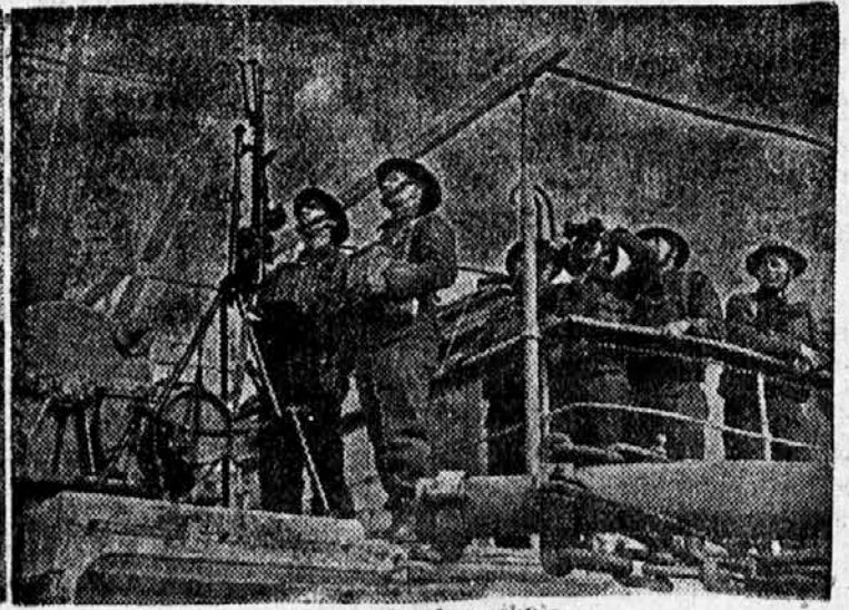
Vzrajanje sovražnega letala prihaja

šlo v Belgijo, 27% v Nemčijo, 3,82% v Anglijo, dalje v Skandinavijo, Južno in Severno Ameriko, v Italijo in Francijo po 1,98%. Potrebno gorivo za visoke peči je dobavljala Luksemburška po večini iz Nemčije. Medtem je bilo tudi dva milijona ton koksa, v zadnjih letih pa holandski premog.