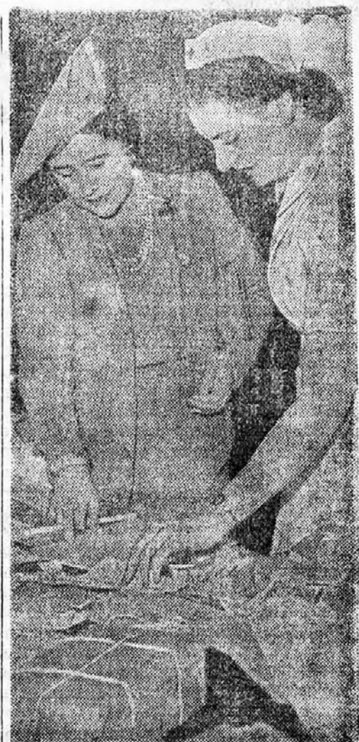
Angleška kraljica ELIZABETA pregleduje darila za vojake na fronti