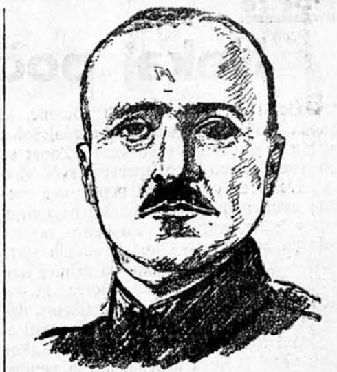
Maršal PIETRO BADOGLIO tehnični vodja italijanskih operacij

Ves hrvatski narod se je spominjal večer obletnice rojstva pokojnik bratov Antuna in Stjepana Radića. »Hrvatski Dnevnik« je ob tej priliki v uvodniku napisal med drugim: »Bila je srečna zamisel, da se rojstni dan bratov Radićev proglasi za dan hrvatske kulture. Še srečnejša je bila misel, izvesti akcijo, da vsak Hrvat tega dne razmišlja, kaj sta brata Radića dala hrvatskemu narodu.