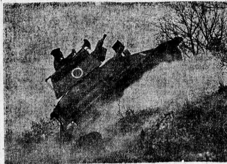
Angleški tank v akciji

je v l. 1939 proizvedel 1,84 milijona ton surovega železa, 1,76 milijona ton surovega jekla. 95% železne rude izvozijo v tujino, 30,34 luksemburškega železa je