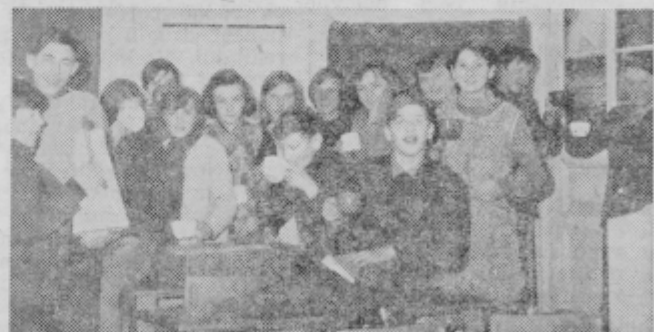
Učenci 8. razreda srebaajo toplo kavo, ki jim v zimskih dneh še posebej tekne

Poleg juršinskih zlatoporočencev, ki sem vam jih že predstavil v zadnji številki