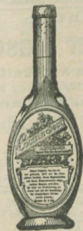
per Drig.-Bouteille 1 fl. 20 kr.

der Amsterdamer Liqueur-Fabriks-Commandit-Gesellschaft in Mödling bei Wien.