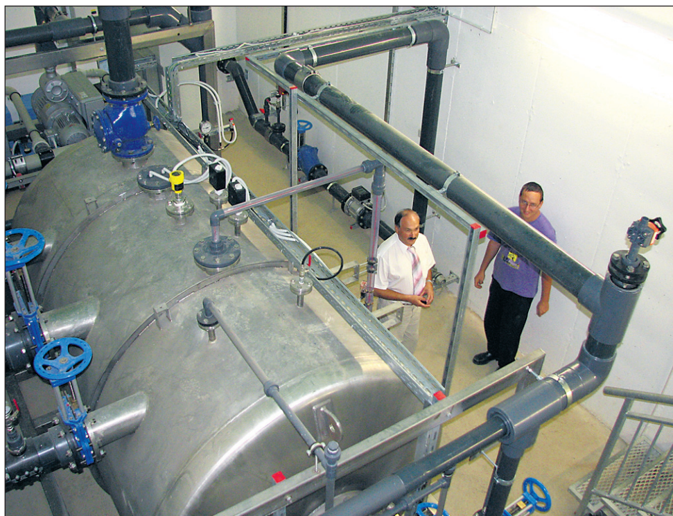
Tako vakuumska postaja (na sliki) kot čistilna naprava delujeta brezhibno in občani se že lahko priključijo na kanalizacijsko omrežje.