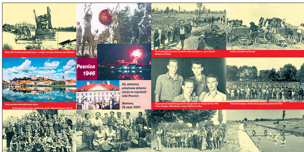
Ob jubileju so organizatorji izdali zloženko o 60. obletnici MDA Pesnica.