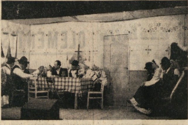
Zgoraj: POGLED NA ODER MED PREDSTAVO. — Spodaj: POLNA DVORANA OBČINSTVA Z ZIVAHNIM ZANIMANJEM SLEDI DOGAJANJU NA ODRU.