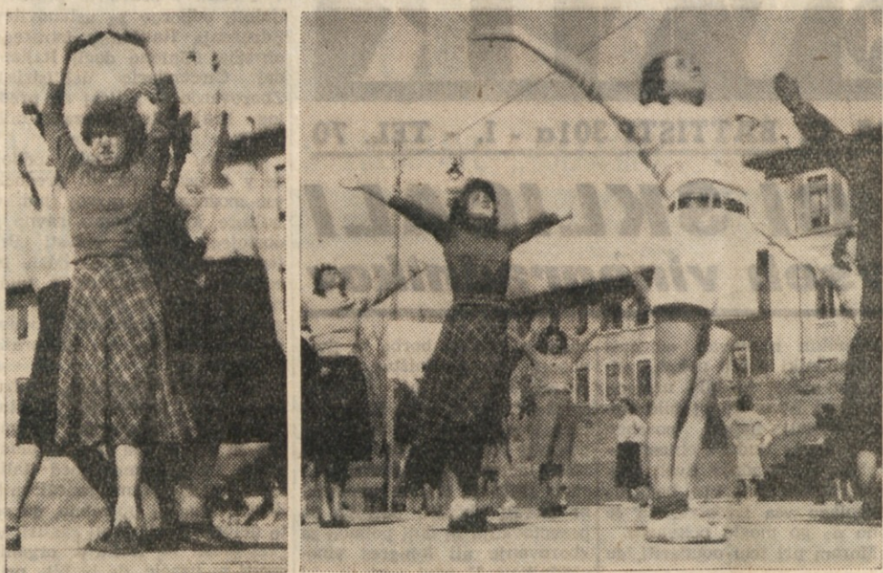
POVSOD SE ŽE PRIPRAVLJAJO ZA PROSLAVO 1. MAJA. TELOVADCI SO SE ZACELI Z VSO VESTNOSTJO PRIPRAVLJATI, DA BO NJIHOV NASTOP BOLJŠI KOT KATERI KOLI DO SEDAJ. NJIHOVA VOLJA JE VELIKA IN ZATO SMEMO PRICAKOVATI, DA BO NAS LETOSNI NASTOP NADKRILIL PO KAKOVOSTI VSE PRETEKLE. ZATO NAJ SE VSI, KI JIM JE PRI SRCU 1. MAJ PRIJAVIJO, DA BODO TUJI ONI SAMI PRIPOMOGLI K VELICASTNI PROSLAVI