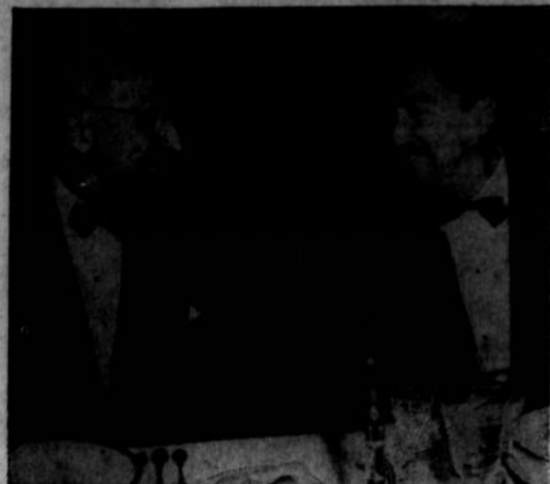
Mehliček predsednik Aleman (desno) je zadnje dni Trumanu vrnil oblik in bil častni gost Amerike. Pravijo, da sta se zelo dobro razumela. Znamenje ožjih odnosov med obema republikama je tudi v tem, ker so tudi v Mehliki začeli posnemati Ameriko v anti-komunistični historiji.

mokres in spet začel streljati. Zadnji naboj je prihranil zase.