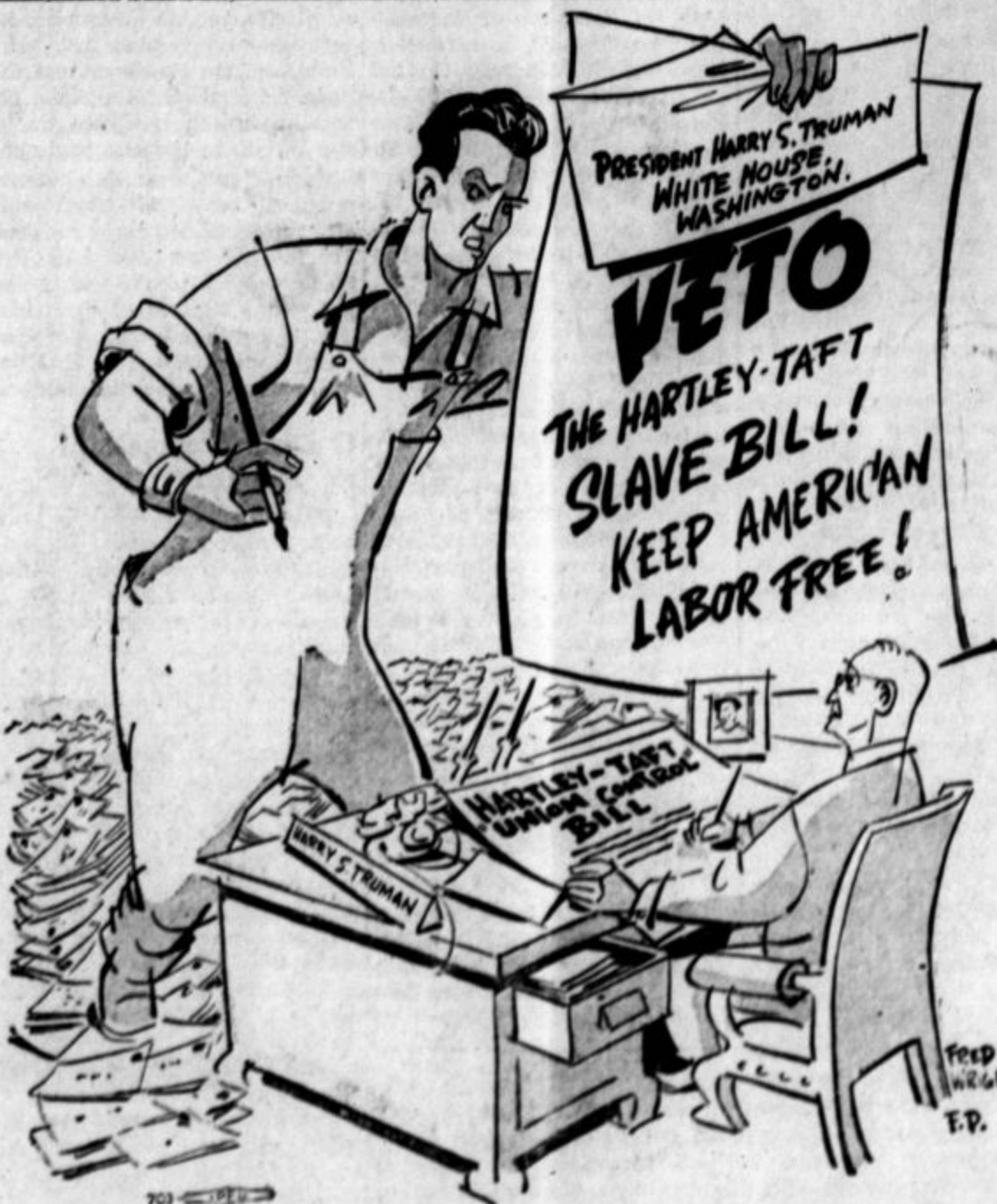
Kaj stori Truman? ... Če bi delavstvo imelo svojo močno politično stranko, bi ne bilo sluha o kakšni protidelavski zakonodaji.

"Možnost depresije v tekstilni industriji ni izključena," je rekel Rieve. "Kompanije v južnih državah lahko znižajo plače, ker delavci niso organizirani."