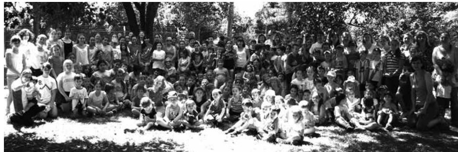
Množica otrok na šolskem izletu