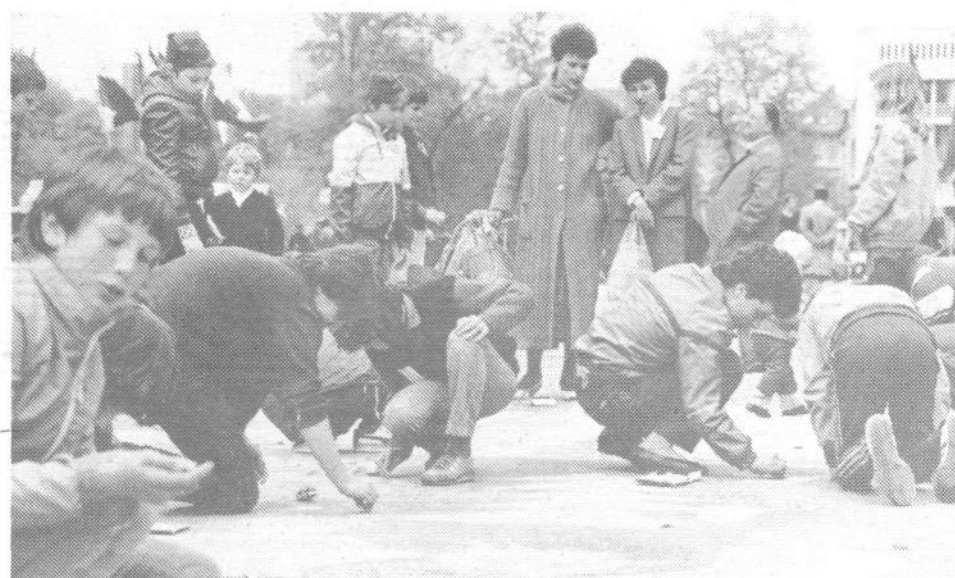
PIONIRJI SO POKAZALI KAJ ZNAJO – Na ulicah in trgih v ožjem središču mesta so otroci risali, recitirali, igrali, kotalkali...

Naj ob tem povemo še to, da so organizatorjem letošnjega Zbora pionirjev stopile naproti številne ljubljanske delovne organizacije, naši učitelji, otroci in starši pa so gostoljubno odprli vrata svojih domov mladim gostom. Ljubljana je spet dokazala, da zna odpreti vrata in da volja najde pot do novih spoznanj. To je bil eden od načinov praznovanja meseca mladosti, drugačen in mladim veliko bližji kot prejšnji.