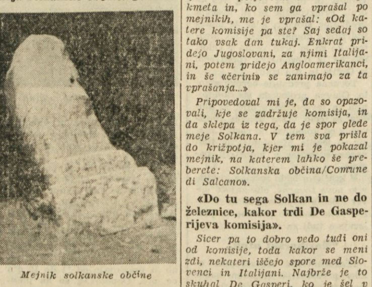
Mejniki solkanske občine

Govoril mi je še o solkanski ob-čini, ki je stara več stoletij. Kolik-or se še spominja, je bil zadnji iz-