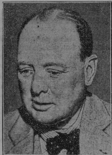
Bodoči angleški obrambni minister W. Churchill.

Tako toži »Pravda«. Kakor sklepamo iz besed imenovanega lista, je sovjetska mladina dvojne vrste. Tisti, katerim so poleg boljševiške vzgoje vcepili starši ali drugi ljudje v srce nekaj verskega čuta, so protirevolucionarji, to je sovražni sovjetski oblasti, tisti pa,