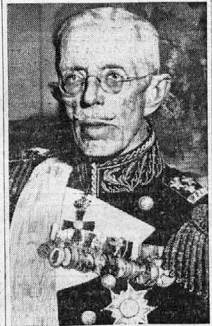
Svedski kralj Gustav V.

Dinamične države se pripravljajo, a tudi statične ne drže križem rok. Kljub vsemu vedrejši pogled v bodočnost