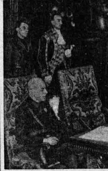
Grof Ciano govori...

Omenili smo Rusijo. Tudi tu gre razvoj pot, ki demokracijam ne bo v škodo. Francija je leta 1935, sklenila z moskovsko vlado pogodbo o vzajemni pomoči. Dalje kakor do te pogodbe vse do danes ni prišlo. Še oktobra 1936. je Litvinov vprašal Léona Bluma: »Ali mislite pomagati Češkoslovaški, če bi jo kdo napadel? Če mislite, bi