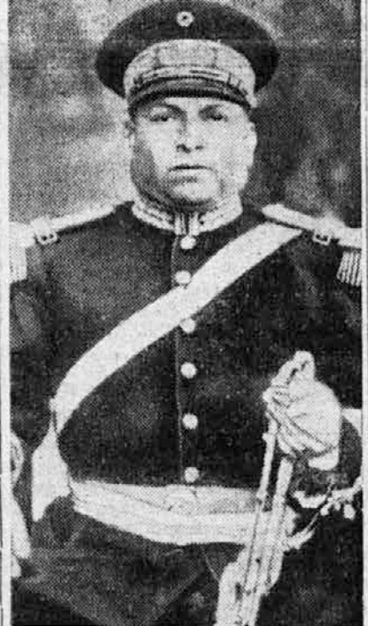
Mehiški general Cedillo.

Tudi statične demokracije ne drže križem rok. Pertinax je zapisal v pariškem tedniku »Europe Nouvelle«, da