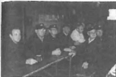
Slike s katerimi smo opremi tokratni »gasilski« članek so nastale na tekmovanju veteranov, o katerem pišemo v članku

Domžai, Lukovice in Litiže so trzinški veterani zasedli tretje mesto, kar je izredno dobra uvrstitev. Še v oktobru pa bodo imeli veterani iz domžalske zveze srečanje na Žejah. Gre predvsem za njihovo druženje in za obujanje spominov. Pred leti smo začeli trzinški gasilci praznovati njihove okrogle obletnice. Tam nekeje od 50 leta naprej. To pomeni, da slavljenju postavimo mlaj in ga poškrpimo z vodo. Zdi se mi lepo, da se nekoliko potrudimo tudi: zanje in da niso čisto pozabljeni.