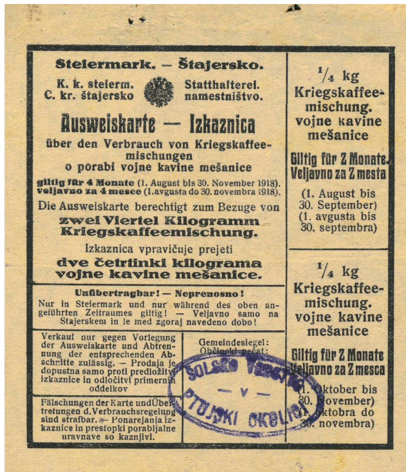
Živilske nakaznice za moko, vojno kavo, krompir, milo in pralni prašek, sladkor in tobak, SI_ZAP/006 Zbirka muzejskega društva Ptuj 1605–1961, šk. 46, ovoj 6/1.

Vodja šole pri Veliki Nedelji Preindl je o teh kartah v šolski kroniki zapisal: »Na karte so revnejši sloji prebivalstva dobili na določeno obdobje določene količine za dostojno preživetje nezadostne količine kruha, moke in drugo. V zadnjem letu vojne (1918) so na karte že dobivali obutev, perilo, obleko (tudi papirnato) in tobak. Piva se je varilo malo, žganjekube so usabnile, le vino je še bilo na dosegu rok in se ga je tudi veliko popilo.« 17