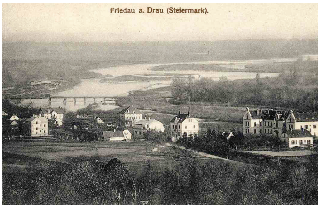
Razglednica Ormožja – veduta, leta 1917, SI_ZAP/0219 Zbirka razglednic, št. 752.

Samski fantje so po pripovedovanju vriskali in peli, vsi ostali pa so hodili sklonjenih glav in se tolažili, da bo vojna kratkotrajna. Vojaki so na fronto odhajali z vlaki, tako so bili kolodvori videti kot mravljišča. Vlak za vlakom je odvažal mobilizirance, dokler niso odšli vsi. 2