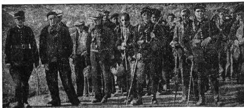
Rdeči španski begunci, ki so jih francoski obmejni vojaki (spredaj) na Pirenejskih razorožili.

»Stalin, Stalin, dnevi so ti šteti. Mi, ki smo osvobodili našo Rusijo, bi radi dali tudi svoje življenje, samo da bi mogli tebe spraviti s sveta. Tvoja smrt bo mnogo bolj grozna kot je bila smrt Tuhačevskega.« Dozdaj GPU še ni mogla izslediti, kdo bi si upal tako korajžno in »nesramno« govoriti o Stalinu. Preiskava se z vso verno nadaljuje. Neki angleški časopis med drugim tudi piše, da je vodja sovjetske ruske tajne službe Ježov v nedeljo odpotoval nenadoma nekam v bližino rusko-poljske meje, »odkoder bo vodil nadaljno preiskavo«. Sovjetskim oblastem se zdi še najbolj verjetno, da je to radijsko sporočilo bilo oddano nekje v Beli Rusiji.