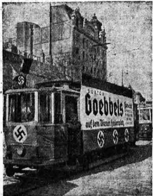
Takole je tudi dunajska cestna železnica vabila ljudstvo, naj gre poslušat Göbbelsov govor.