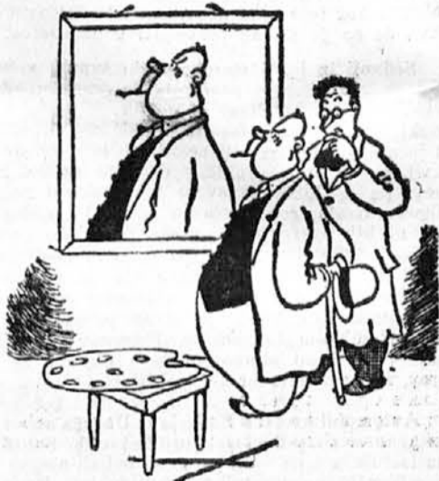
Za božjo voljo, ali ste čisto znoreli. Saj vam vendar nisem naročil, da naredite karikaturco.

To razstavo je priredilo Društvo zbiralcev takšnih vojaških postavice. To društvo ima dozdaj nekaj nad 300 članov, ki niso samo Francozi, pač pa jih je precej doma tudi iz drugih evropskih držav.