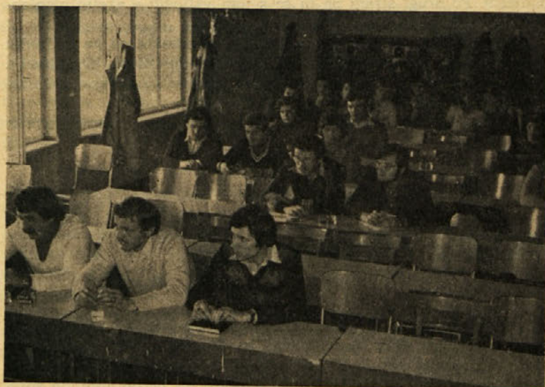
Slušatelji mladinske politične šole

Komisija za idejno politično delo je že izdelala smernice o cilju in temah šole, razmišljali pa smo že o predavanjih in času šole. Zelo pomembno pri organizaciji te izobraževalne oblike je nedvomno vr-