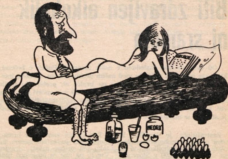
Sem vse poizkusil, a ni haska.