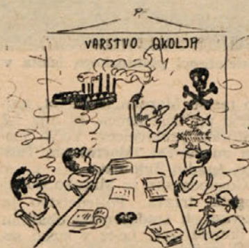
Skrbimo za okolje! Kaj pa naša pljuča?