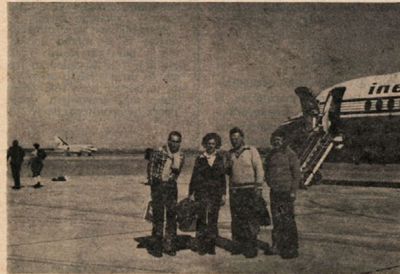
Udeleženci planinskega izleta v Afriko na letališču v Marrakechu.

Maroko je pretežno gorata država. Gorovje Atlas se razteza v treh verigah: Visoki Atlas z najvišjim vrhom Toubkal 4165 m, Srednji Atlas in Anti Atlas. Podnebje je na severu sredozemsko, v notranjosti kontinentalno, ki preide na južnih obronkih Atlasa v puščavsko. Glav-