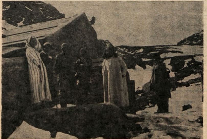
Skupina nosačev pri Neltnerju — 3207 m

Medtem, ko so polnili gorivo, smo ostali v letalu. Torej smo