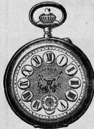
Genius: G 37 1 52 7

Ljubljana, Jurčičev trg št. 3 blizu čevljarskega mosta pod Trančo urar in trgovec z juveli, zlatnino in srebrnino priporoča bratom narod. socijalistom svojo bogato zalogo najnovejše naročenih predmetov svoje stroke. —