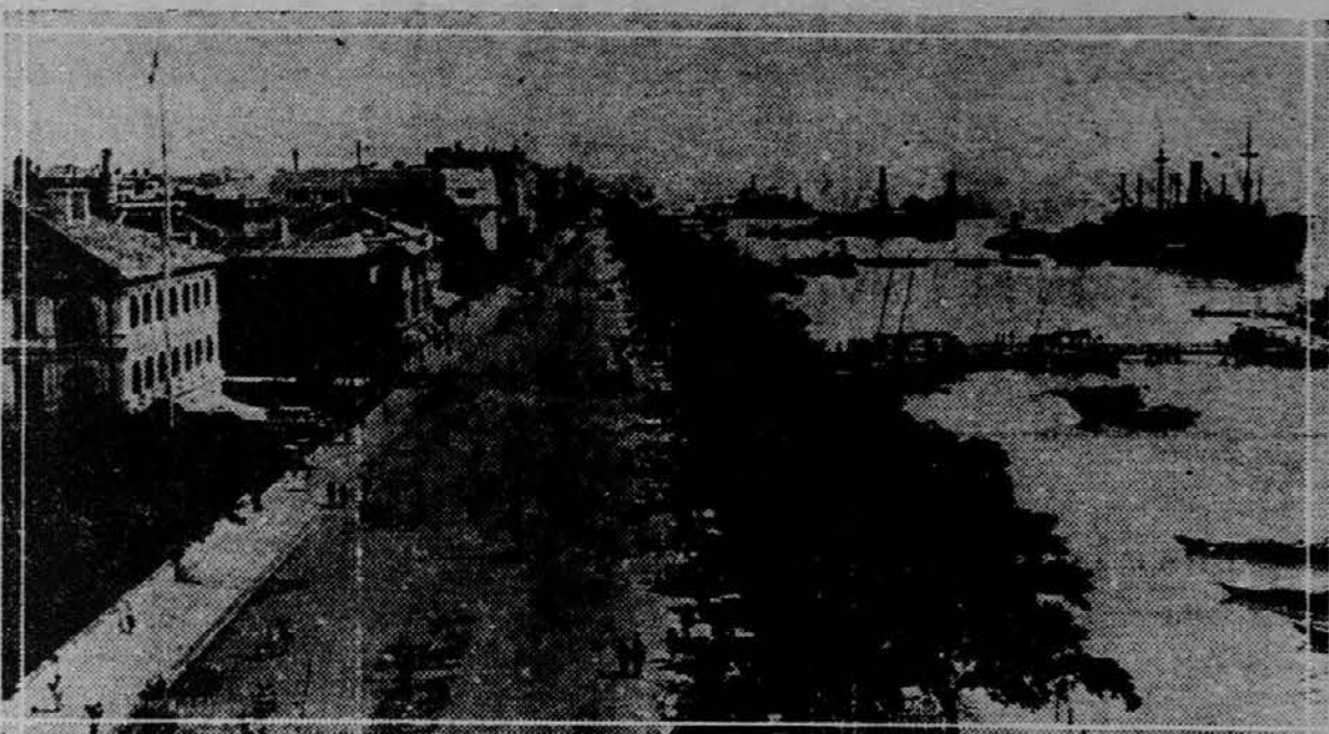
V pristanišču kitajskega mesta Hankova je zasidrano močno angleško brodovje, kojega namen je ščititi angleško naselbino pred napadi kitajskih vojakov.