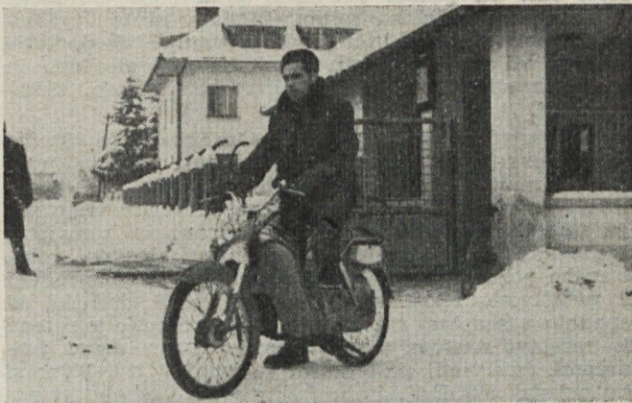
Vožnja z mopedom na zasneženi cesti zahteva veliko pazljivost

8. Prepovedano je čiščenje in popraviljanje strojev med obratovanjem. Stroj smejo voditi in popravljati samo tiste osebe, ki so za to določene in je to njihova dejavnost.