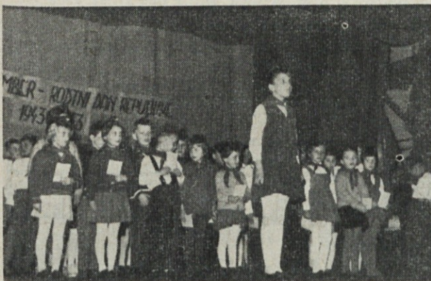
Mladina iz Induplati na proslavi 29. novembra

Torej mladinci, mladinke, pristopite k delu, kajti le po delu vas čaka zaslužen razvedrilo.