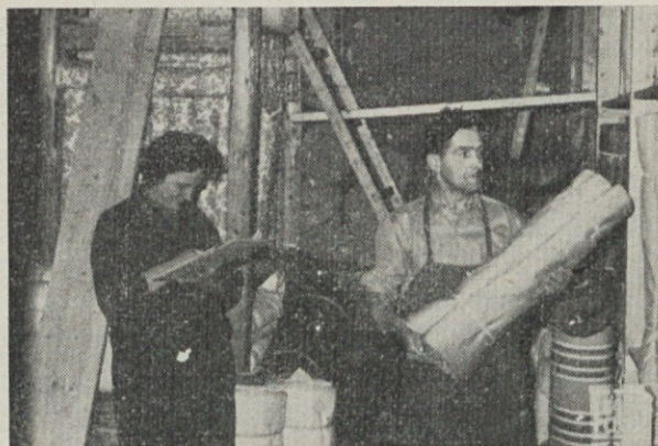
Inventura v skladišču gotovega blaga

Kakor že omenjeno se mora narediti inventura letno enkrat, ki pa mora biti popolna in točna. Lahko pa se dela inventura tudi med poslovnim letom večkrat. V našem podjetju delamo inventure vsak mesec, ki pa