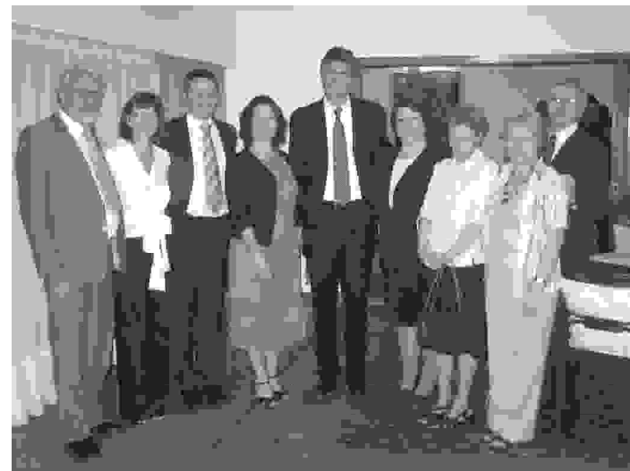
Ob priložnosti obiska ministra Zvera. Na njegovi levi ravnateljica in profesorji STRMB