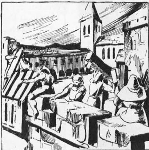
53. Tako je b'lo v kloštru v Stični, ko pride poročilo, da je Turek prihrumel v deželo. Vsi so pozabili na bolnega Marka. V kloštru so popravljali poškodovano obzidje, znašali živež s pristave in vse pripravljali, da bi se branili Turkom do zime. V tem splošnem vrtenju ni n'čie mislil, na zaprtega cigana. Nekega jutra tiča ni bilo v gnezdu. Kako je ušel, tega nihče ni vedel.