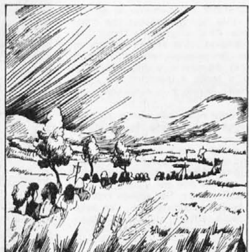
55. Ta čas pa, ko so v kloštru pripravljali procesijo, napade Ahmedpaša malo slovensko vojsko in jo pokolje, mnoge plemiče pa ujame. Veselo je vstajalo sonce in s'jalo na polja in travnike. Par za parom je šel v procesiji iz kloštra. Najprej menihi, za njimi plemeniti gospodje, za temi pa so stopali kmečki ljudje, moški in ženske. Počasi se je vila kot dolga kača.