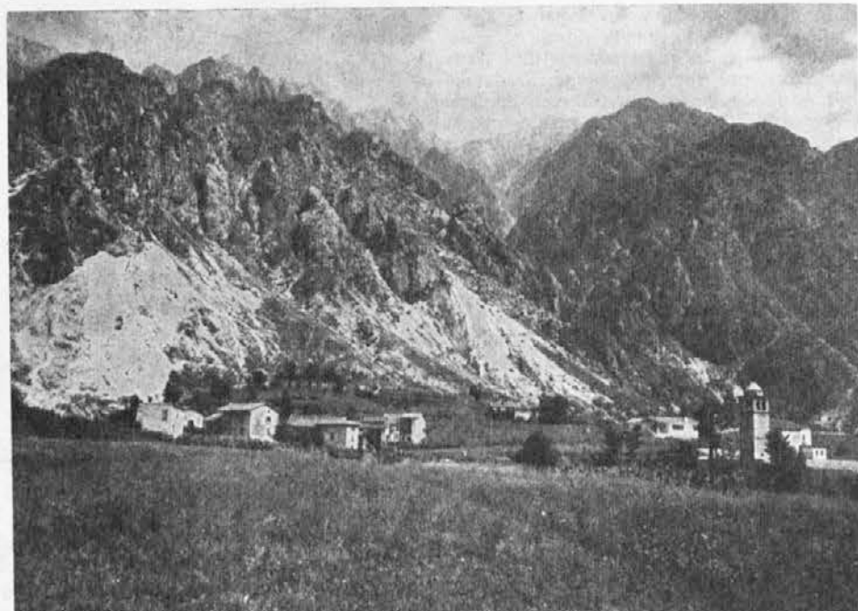
Na sliki vidimo vas Osojani v dolni Reziji, skozi katero bo potekala nova avtocesta, ki bo vezala z Avstrijo. Če bodo uresničili ta načrt, vasiva ne bo več izolirana in se bo tudi ekonomsko opomogla