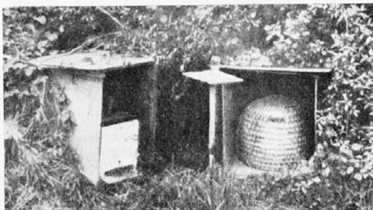
5. slika: Umetni gnezdišči s krmiščem v ospredju v nekem Lindauerjevem poizkusu.

postavil lesen panj in slamnat koš ter ju primerno zavaroval pred vnanjimi vplivi (5. slika). Nad 100 čebel se je vsak dan gnetlo okrog krmilne skledice in odnašalo z medom pomešano sladkorno raztopino v panj, medtem ko ni bilo videti na umetnih gnezdiščih niti ene. Doma so čebele hrano razdelile mladice, nato nekoliko zaplesale in spet odletele na bero. Čez nekaj dni se je razevel tel divji kostanj in paša je postala tako obilna, da so se sati vidno polnili z medom. Mladice so začele odklanjati prineseno medicino in zato je nabiralna vnema pašnih čebel čedalje bolj pojemala. Na krmišču je bilo opaziti le še tu in tam kako čebelo, a celo ta je sesala sladko tekočino tako malomarno, kot bi se ji vse skupaj upiralo. Plesi nabiravk hrane so v panju popolnoma prenehali in nastopilo je splošno brezdelje. Tedaj so se pojavile pri umetnih gnezdiščih prve izvidnice in na satih prve plesavke,