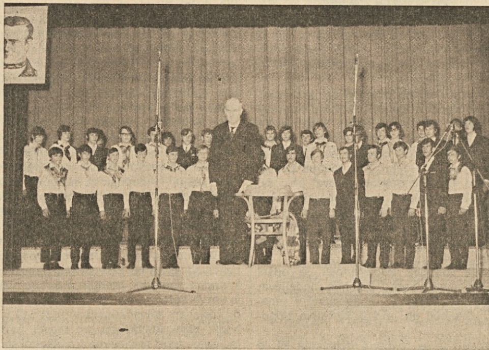
Blagi pokojnik obdan od pevčkov „izbranega zbora“