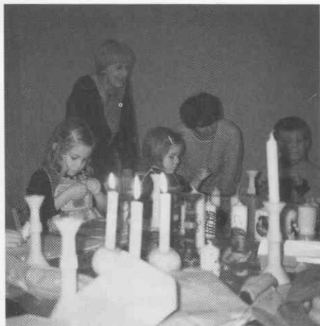
Delavnica okraševanja sveč z voskom in barvanje lesenih svečnikov.