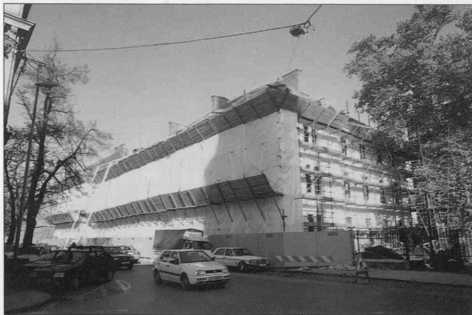
Bodoča upravna stavba Slovenskega etnografskega muzeja med prenovo.

Večina dosedanjih poročil o delu Slovenskega etnografskega muzeja se začne ali končuje s poročanjem o prostorski problematiki in njenem reševanju. Za leto 1996 pa lahko končno zapišemo, da je glede tega prineslo zelo stvarne spremembe. Spomladi sta bila za prvi, manjši objekt št. 28 v kompleksu na Metelkovi končana projekt za pridobitev gradbenega dovoljenja in projekt za izvedbo. Na javnem razpisu za izvajalca gradbeno - obrtniških in inštalacijskih del je bilo izbrano Gradbeno podjetje Grosuplje, ki je 21. junija s predajo ključev objekta začelo z delom. V skladu s pogodbenimi roki bo objekt, ki je namenjen upravi, kustodiatom, restavratorsko - konservatorskim dejavnostim ter za javnost odprtim dokumentaciji, knjižnici in večnamenskim prostorom, dokončan marca 1997.