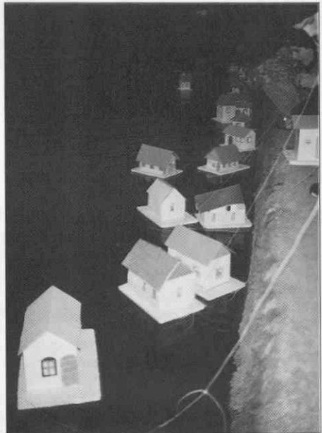
Gregorčki, ki so jih učenci 5. in 6. razreda OŠ Kolezija na predvečer Gregorjevega spustili po Ljubljani.