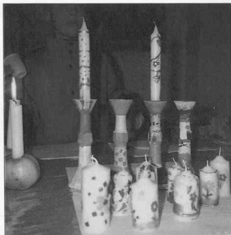
Izdelki najmlajših udeležencev muzejske delavnice. (Foto I. Keršič, 1996)

legende in scenske postavitve. Razstavo sta oblikovala arhitektka Mojca Turk in Peter Rau, Lado Jakša pa je uglasbil temo udomačene svetlobe, ki popelje obiskovalce po razstavi od netenja ognja do mitične svetlobe.