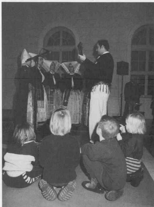
Ansambel z otoka Paga na odprtju razstave Paška čipka.