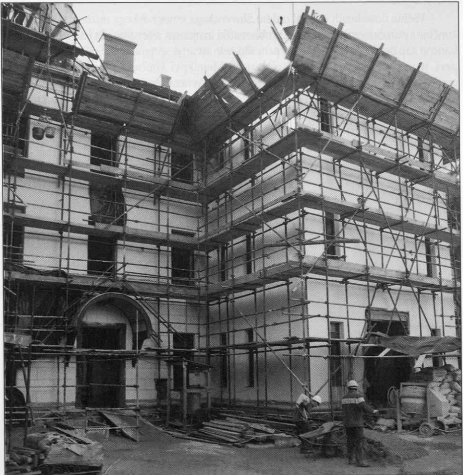
Glavni vhod. (Foto I. Omahen, 1996)