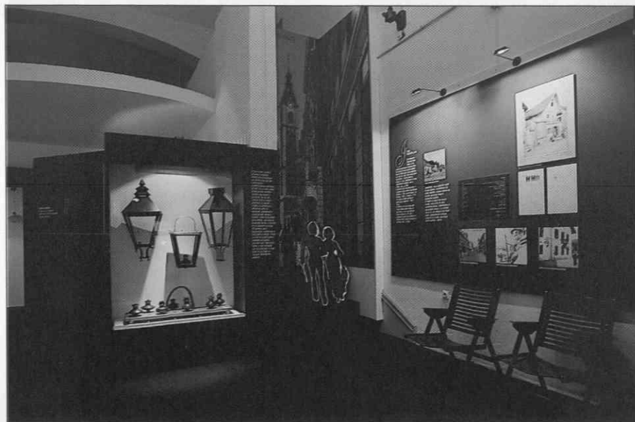
Razstava Udomačena svetloba. Kontrast svetlobe in teme je vplival na izbiro razstavne tehnike in njenih barv, rumene kot svetloba in temno modre kot tema.

Razstavo je pripravila kustodinja za bivalno kulturo Irena Keršič. Na njej je prikazanih 184 svetlobnih teles (zbirka svetil šteje 511 predmetov), ki so razdeljena po funkciji in času, obravnava pa še posebne oblike razsvetljevanja, ki so se razvijale doma, v javnosti, v prometu, pri delu, pri čaščenju, šegah in praznovanjih, ter prikazuje izdelavo goriv za tradicionalna svetila in njihovo uporabo oziroma preoblikovanje za današnji način življenja. Prikaz dopolnjujejo, razlagajo in dokazujejo številne fotografije, grafike,