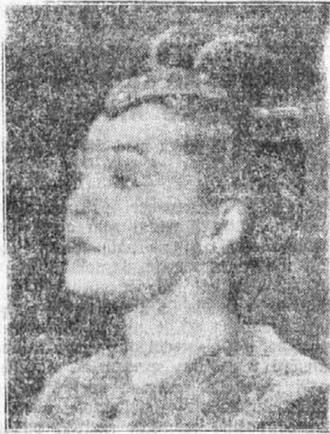
ZARAH LEANDER