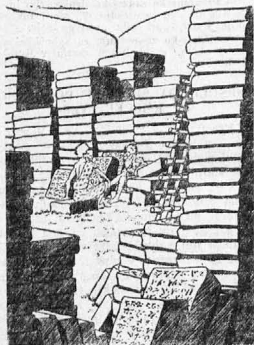
Iz kameno dobe

— Gospod urednik, zakaj prav za prav ne vračate neuporabnih rokopisov?