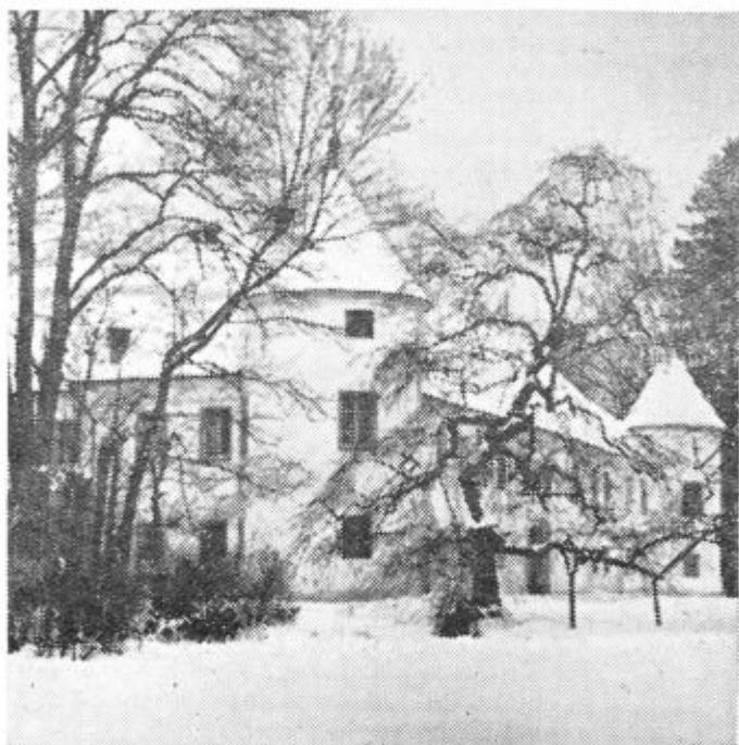
Grad v Beltincih