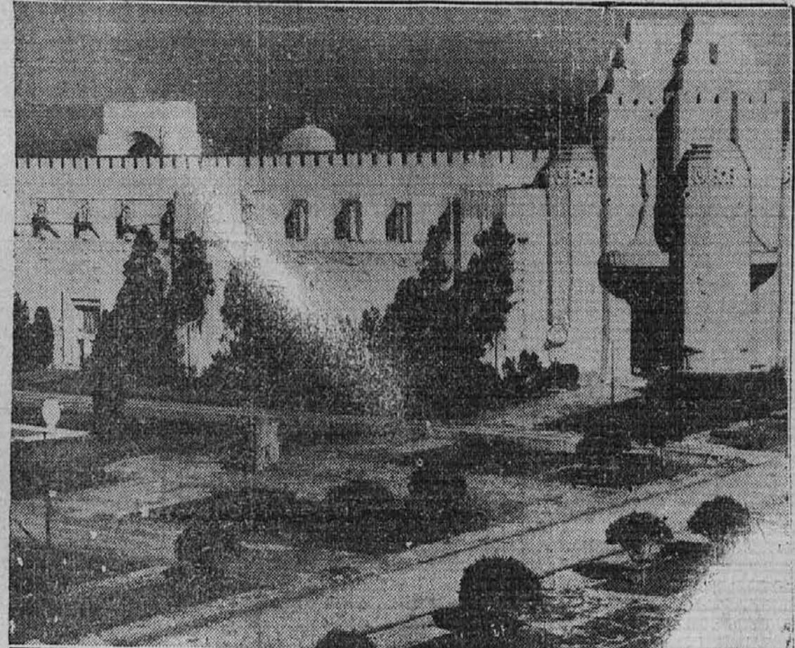
Ena najbolj privlačnih posebnosti na Golden Gate mednarodni razstavi, ki se bo vršila letos v San Francisco, Cal., bo gotovo palača, v kateri bodo kazane vrtnarske umetnosti. Slika kaže to plosčje z vrtno v ospredju.