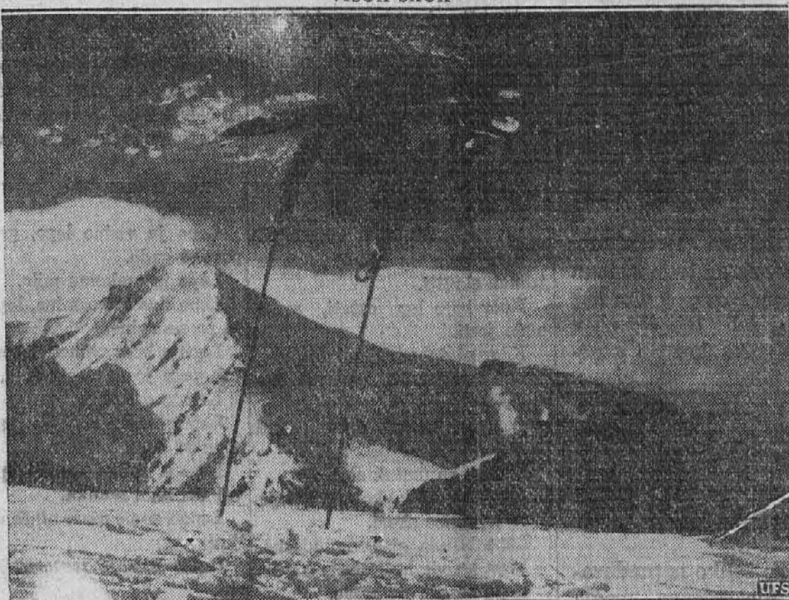
Drzen skok, ki ga je napravil neki češki smučar v pogorju Visoka Tatra na Čehoslovaškem, blizu Prage.

odpusti, ako je resnično ne obžaluješ. V nekem smislu ti je niti ne more odpustiti, dasi je vse-mogočen. Velik je Bog v svoji moči, a ravno tako velik je tudi njegov srd do greha. Ali naj bi te neskončno sveti in čisti Bog, v čigar obeh je tudi najmanjši greh neizrekljivo grd, sprejel v svoje sveto prijateljstvo in izlil duha svojega v dušo tvojo, dokler v ti duši vlada smrtni greh? Saj postaneš nekako greh sam, ako se ga okleneš. Greh ni samo le tebi največje zlo, temveč v nekem pomenu tudi edino zlo Bo-gu. Zato se Bog edinole na grehu maščuje in se mora maščevati na grešniku, če pade grešnik v njegove roke, preden se je greha skesal.