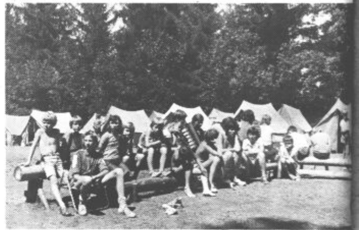
Pesem tudi med opoldanskim odmorom.

Tabor v Ribnem smo zapuščali s prijetnimi občutki in željo, da bi omogočili bivanje v naravi čim večjemu številu mladih, predvsem osnovnošolcem, ki bi svoje znanje obogatili z življenjem v prirodi, ki se vse bolj „odmika“ mladim ljudem. Še nekaj zapisov iz knjige vtisov v taboru „Kajuh“: