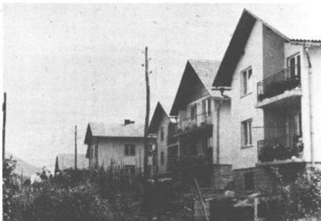
Tudi te lepe hiše ob glavni cesti v Pesju so bile brez zastav

Le na redkih smo opazili zastave. Tudi v Šoštanju so marsikje pozabili na zastave, najslabše pa je bilo v Pesju. Resda nismo prečesali kraja po dolgem in po čez, vendar nam je dovolj že pogled z glavne ceste. Zastava je visela le na zadruženem domu, pa še ta je bila narobe obrnjena, na gasilskem domu pa smo jo komaj opazili, ker je čisto zbledela.