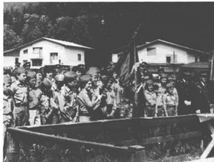
Mladi gasilci – pionirji, člani gasilskega društva Mislinja, s praporom.

Ob tej priložnosti so pionirji – člani gasilskega društva Mislinja razvili zastavo. Prapor mladih gasilcev iz Mislinje je drugi pionirski gasilski prapor v Sloveniji (prvega so dobili mladi gasilci iz Soštanja).