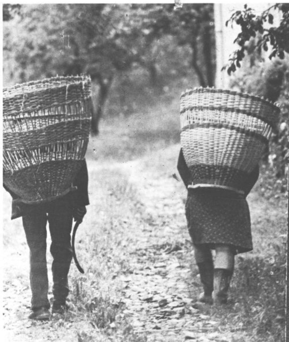
Čeprav tudi na deželo prodira mehanizacija, vsepovsod stroji vendarle ne morejo. Zato danes prav gotovo ni kmetije, kjer ne bi poznali tega starega pripomočka, pod katerim so se leta in leta šibila ramena naših očetov in mater. Res pa je tudi, da so danes že zelo redki tisti mladi ljudje, ki bi znali narediti koš.

Na rudarsko-elektroenergetskem kombinatu Velenje bodo v prihodnje bolj organizirali razne oblike obveščanja delavcev. Na področju rekreacije delavcev je treba še več storiti kot doslej. Organizirati je treba potrebne akcije, da bo na sindikalnih igrah med temeljnimi organizacijami združenega dela sodelovalo čim več delavcev. Sindikalne izlete je treba organizirati v kraje znane iz narodno-osvobodilne borbe ter v druge rekreativne, športne in kulturne centre. Vso skrb bodo posvečali rekreaciji delavcev med letnim oddihom, koriščenje zimskega dopusta pa je treba urediti pod enakimi pogoji kot letnega. Zelo pomembne pa so tudi naloge sindikata na področju povezovanja in sodelovanja s sindikalnimi organizacijami drugih delovnih organizacij. Povezovali se bodo predvsem v sindikate s področja energetike in rudarstva in si prizadevali, da se sprejme enoten samoupravni sporazum o delitvi dohodka in osebnih dohodkov. Pri republiški konferenci sindikata za energetiko in rudarstvo je treba oblikovati poseben organ, ki bo usklajeval delovanje sindikata in vse samoupravne sporazume za premogovnike ter metalne in nemetalne rudnike. Prizadevali si bodo za enoten sistem financiranja solidarnostne beneficirane delovne dobe in se zavzemali, da bodo o ceni premoga in kilovatne ure odločali predvsem proizvajalci.