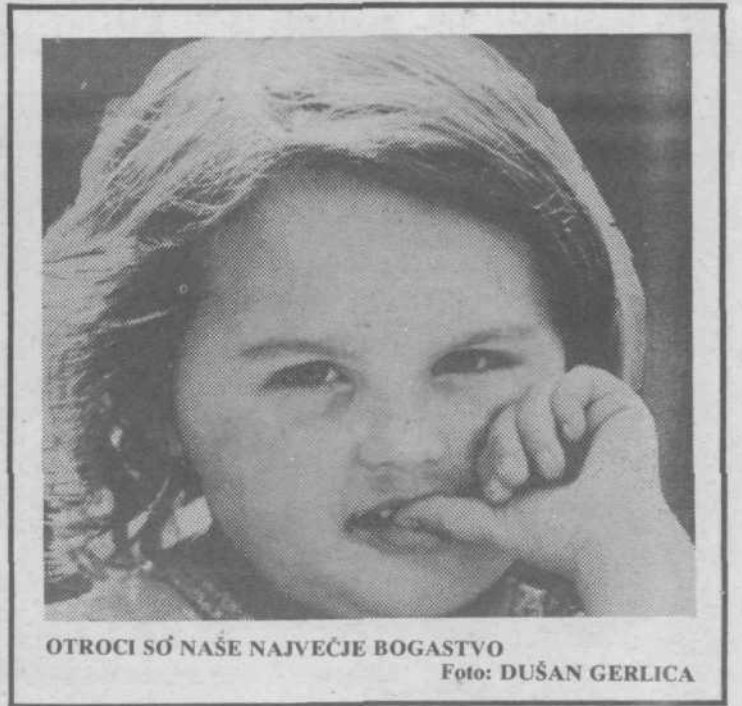
OTROCI SO NAŠE NAJVEČJE BOGASTVO