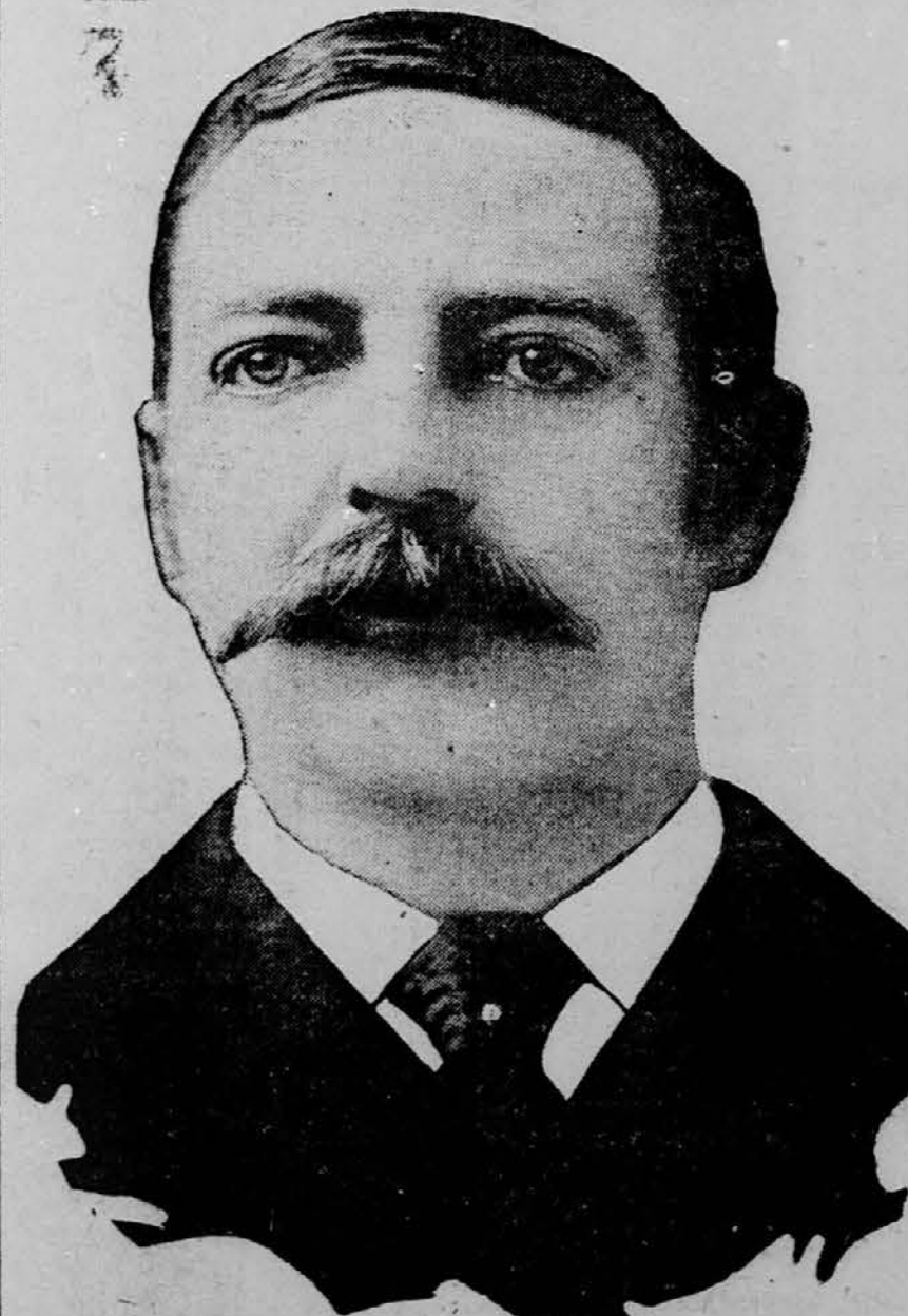
Naša nam slika kaže ameriškega poslanika v Petrogradu, Curtis Guilda, katerega stališče je sedaj znatno otežkočeno vsled nastale napetosti med Rusijo in Združenimi državami radi vprašanja potnih listov ameriških židovskih državljanov. Kakor znano, zahtevajo zadnji odločno, da prizna Rusija njihove potne liste, inšče pa da naj Združene države razveljavijo pogodbo z Rusijo iz leta 1832.