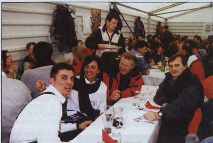
Najhitrejši med moškimi so bili srednjih let.