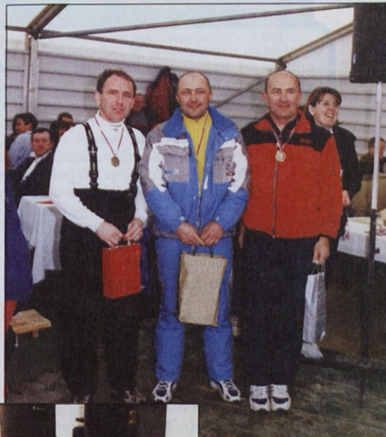
Predstavniki Maxija so bili zelo zadovoljni.