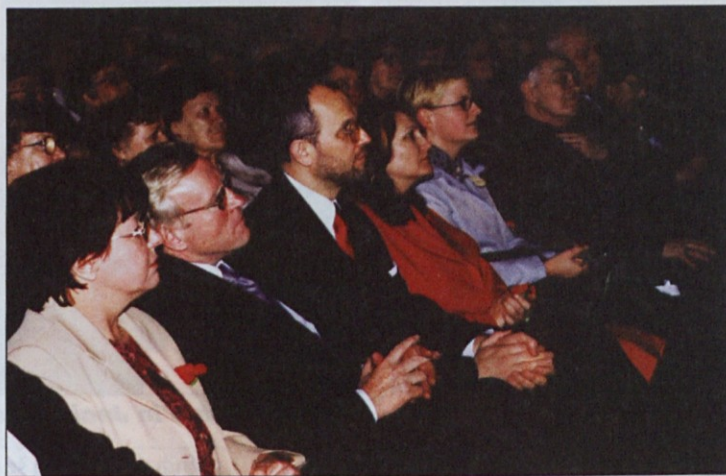
Med udeleženkami proslave je bilo veliko sindikalistov.

Udeleženske in udeleženci so bili s proslavo, ki je bila zares odlično pripravljena, zelo zadovoljni, kar so izpričali s številnimi in dolgotrajnimi aplavzi. Zato si vsi, ki so sodelovali v organizacijskem odboru, zaslužijo, da jih omenimo. Proslavo so organizirali: vladni urad za enake možnosti, mestna občina Maribor, Zveza svobodnih sindikatov Slovenije, Sindikat zdravstva in socialnega skrbstva Slovenije, Sin-