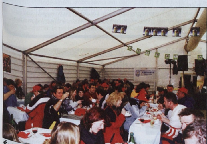
Šotor na Rogli je bil skoraj pretesen.