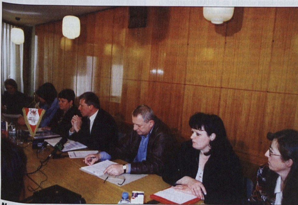
Na tiskovni konferenci vodstva Stupisa so sodelovali tudi sindikalni zaupniki.

Vodstvo Sindikata delavcev tekstilne in usnjarskopredelovalne industrije Slovenije (Stupisa) je to sredo na tiskovni konferenci opozorilo na nov val zapiranja podjetij in odpuščanja presežnih delavcev.