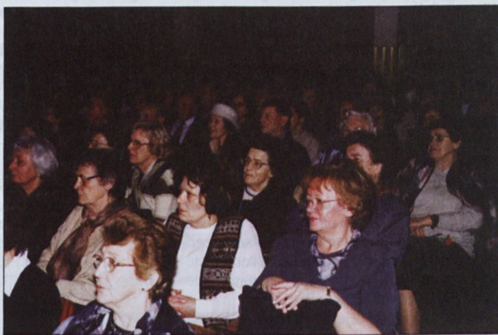
Dvorana je bila polna do zadnjega kotička.

dikat lesarstva Slovenije, Sindikat gozdarstva Slovenije, Sindikat obrtnih delavcev Slovenije, Sindikat delavcev trgovine Slovenije, Sindikat tekstilne in usnjarskopredelovalne industrije Slovenije, Sindikat delavcev prometa in zvez Slovenije, Območna organizacija ZSSS Podravja, Sindikat zdravstva in socialnega varstva Slovenije, KNSS Neodvisnost, Policijski sindikat Podravja, Društvo vojnih invalidov Maribor, Združenje borcev in udeležencev NOB Maribor, Društvo Dobrnič, območna organizacija Združene liste socialnih demokratov Maribor, Kinematografi Maribor in Florina Maribor.