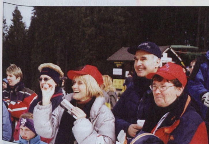
Navijači iz Štajerske so se pomešali z Dolenjkami.