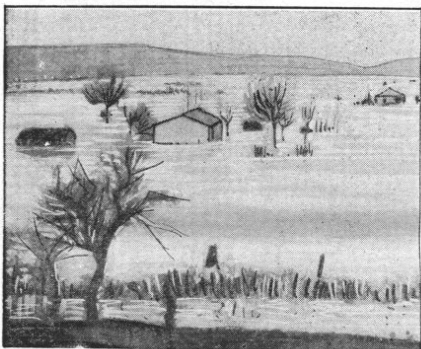
Povodenj na Francoskem — Slika poplavljene pokrajine pri Villematierju