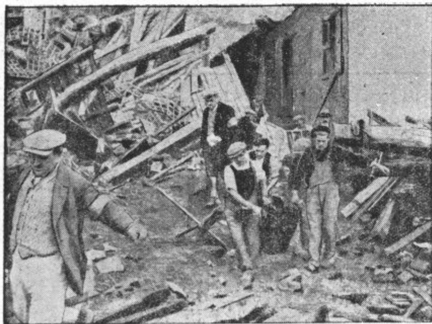
Stanje v francoskem poplavljenem ozemlju

Sila poplave je poškodovala dvotirno železnico pri Montaubanu. Tračnice so mestoma skrivljene in celo pretrgane.