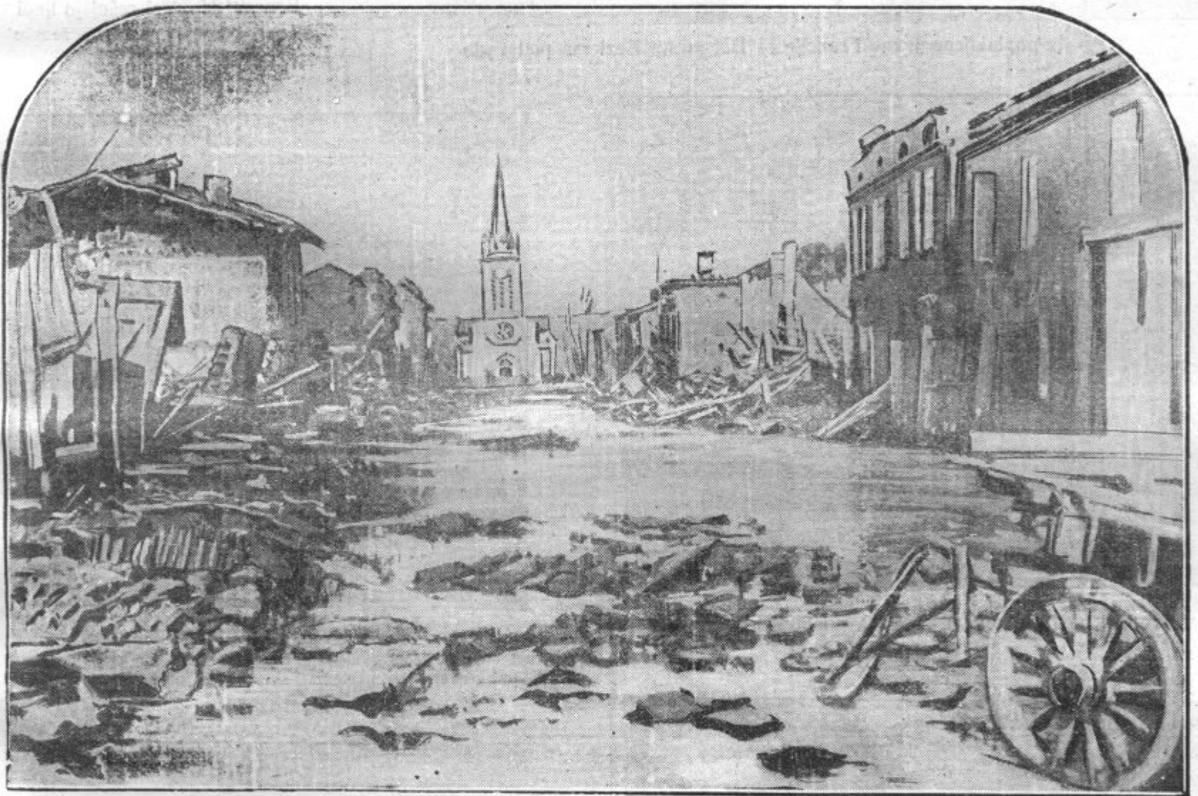
Kraj Reynles (departma Tarn-et-Garonne) uničen od poplav. Ostala sta le cerkev in županstvo.

V vsej južni in zapadni Franciji so se vrstili početkom t. m. strašni nalivi. Vse reke so narasle deloma zaradi dolgotrajnega deževja, deloma pa zaradi naglega tavanja snega v Pirenejih. Naraščanje rek je bilo tako naglo, da so bili onemogočeni vsi varnostni ukrepi. Vse reke so prestopile bregove in poplavile več tisoč kvadratnih kilometrov. Najhujše so bile poplave v področju reke Tarn, ki je porušila večino obrambnih nasipov in poplavila ne samo prostrana polja, marveč tudi mnogo mest in vasi.