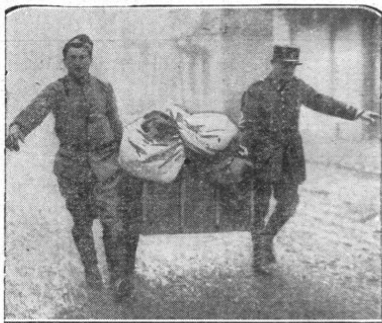
Francoski vojaki prinašajo živež in obleko za poplavljenice

Predno bo mogoče misliti na obnovo porušениh selišč, je treba pospraviti razvaline, pred vsem pa pod njimi zasute ljudi. Slika nam prikazuje grozoto razdejanja in delavce, ki odnašajo med ruševinami odkrito truplo ponesrečenca.