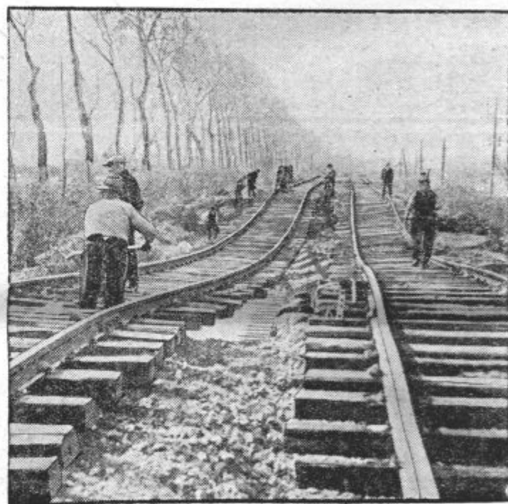
Železniška proga po povodnji

Sila poplave je poškodovala dvotirno železnico pri Montaubanu. Tračnice so mestoma skrivljene in celo pretrgane.