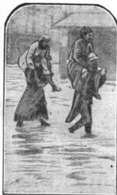
Senegalski črnči rešujejo ljudi Vojaki odnašajo onemogle ženske iz poplavljenih domov.