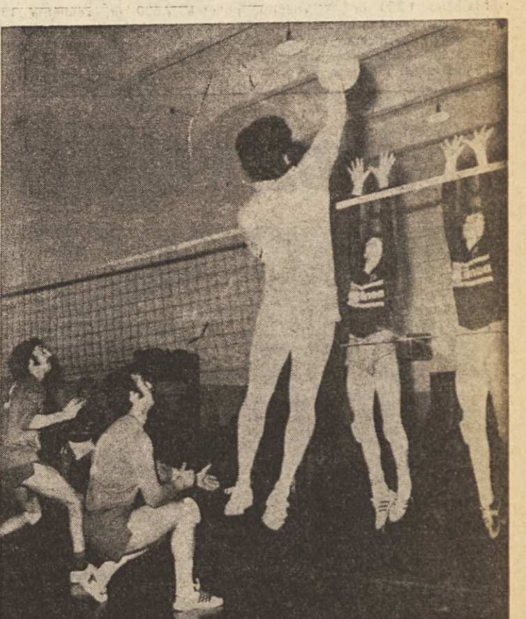
Nastopi Sloge (na sliki med tekmo z Arc Lineo) in goriske Olimpije dokazujejo, da slovenska moška odbojka v zamejstvu ponovno polagoma pridobiva na svoji nekdanji veljavi

reditev otvoritvena dirka v deželi. Proga bo podobna lanski, s simboličnim startom v Lonjerju, nato z letičnim startom v Boškutu, nakar bo pot potekala takole: Bošket - Lovce - Katinara - Bazovica - Padričev - Trebče - Opčine - Prosek - Križ - Nabrežina - Sesljan - Mavhinje - Praprost - Sempolaj - Gabrovce - Prosek - državna cesta št. 202 - Razklani hrib - Katinara - Naseleje sv. Sergija - Domjo - Dolžina - Boršt - Ključ - Lonjer. Dolžina proge bo merila 80 km, start v Lonjerju pa bo ob 14. uri.