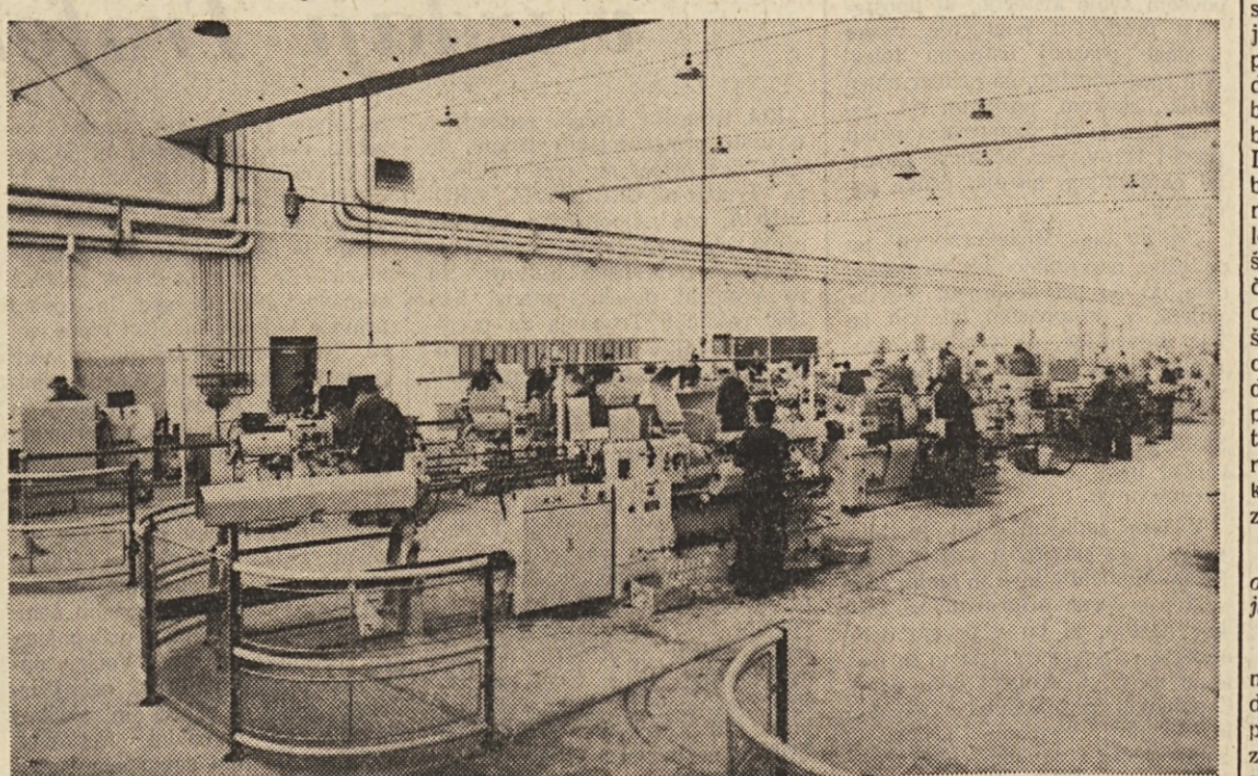
Proizvodna hala v tovarni Tomos

— Naše čitatelje bo nedvomno zanimalo, kakšen je sploh trenutni položaj v vaši panogi. Kje vse upo-