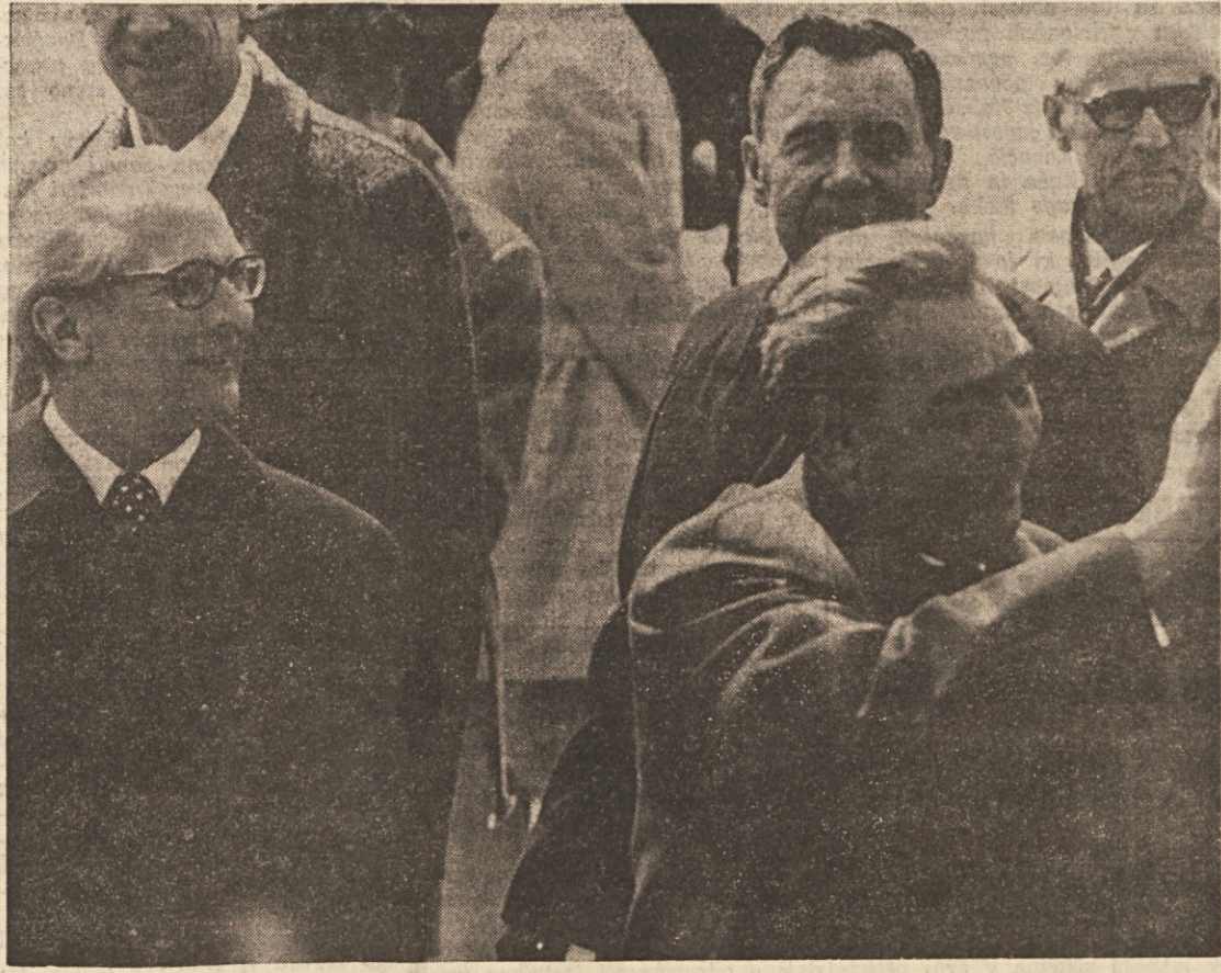
Na berlinskem letališču je Brežnjeva (desno) dočkal tajnik vzhodnonemške partije Honecker (levo)

BEograd, 12. — V Zagrebu se je danes pričela vzhodnoevropska konferenca o preprečevanju raka. Organizatorja konferenca, na kateri sodelujejo ravnatelj najboljši znani inštitutov za borbo proti raku in drugi strokovnjaki iz vzhodnoevropskih držav, sta komisija za borbo proti raku pri UICC v Ženevi in liga za borbo proti raku Hrvaške.