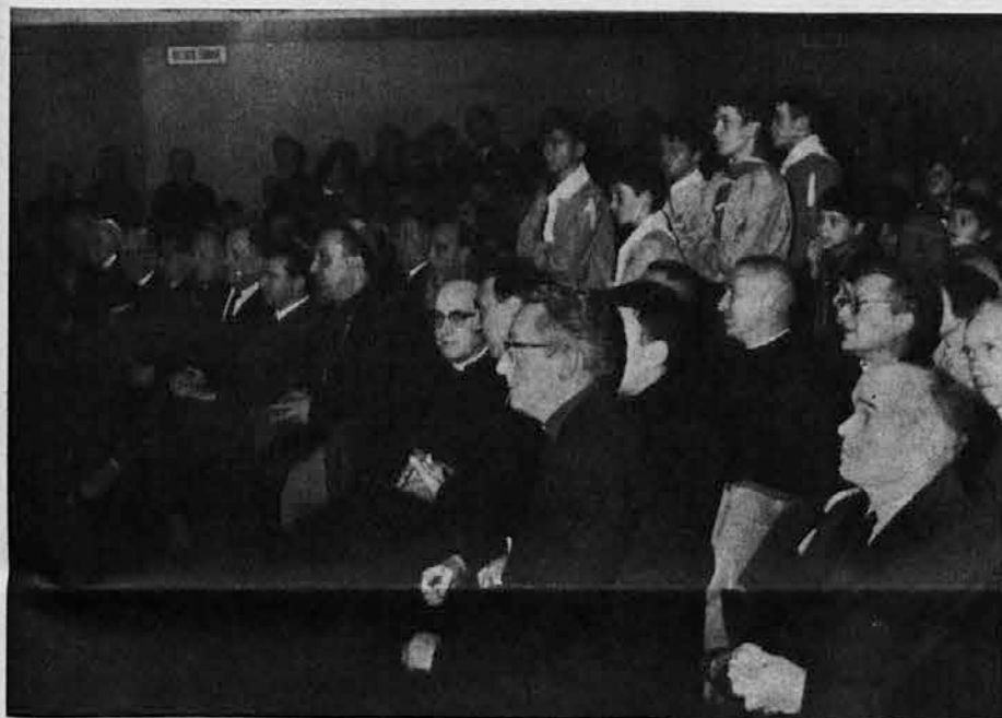
Pogled na prvo vrsto v dvorani Katoliškega doma, kjer je videti našo duhovščino ter zastopnike našega kulturnega, političnega ter javnega življenja, zbrane okrog goriškega nadškofa

S temi mislimi, ki ste jih vi privzeli in ki jih tudi jaz prevzemam kot modra navodila za delovanje in za način aktivnosti, želim, naj današnja proslava postane začetek res bratskega sodelovanja in obnovljene zaveze, da bomo z apostolsko dejavnostjo in s prizadevanjem za edinost prispevali k blaginji naše nadškofijske družine.