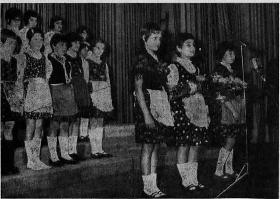
Deklice iz Standreža s šopkom belih rož v roki pozdravljajo svojega nadpastirja