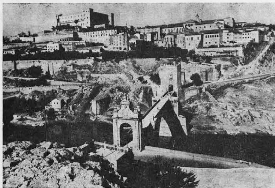
Mesto Toledo, ki ga ovija reka Tago. Poslopje na vrhu griča je obnovljeni Alcazar, spodaj rimski most z nekdanjimi mestnimi vrati

Ko je izbruhnila 18. julija 1936 državljanska vojna, je ta kip s pomembnim napisom postal trn v peti španskim komunistom. Že trinajst dni po izbruhu so se