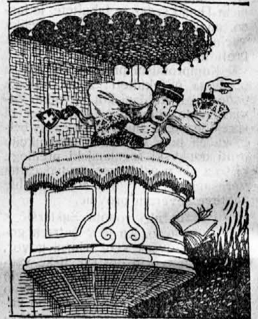
Ta 5. pridiga al od tega peklenkega smradu.

nedeljske pridige od tega pekla na svitlombo venkej dane skozi gospoda Bavbava.