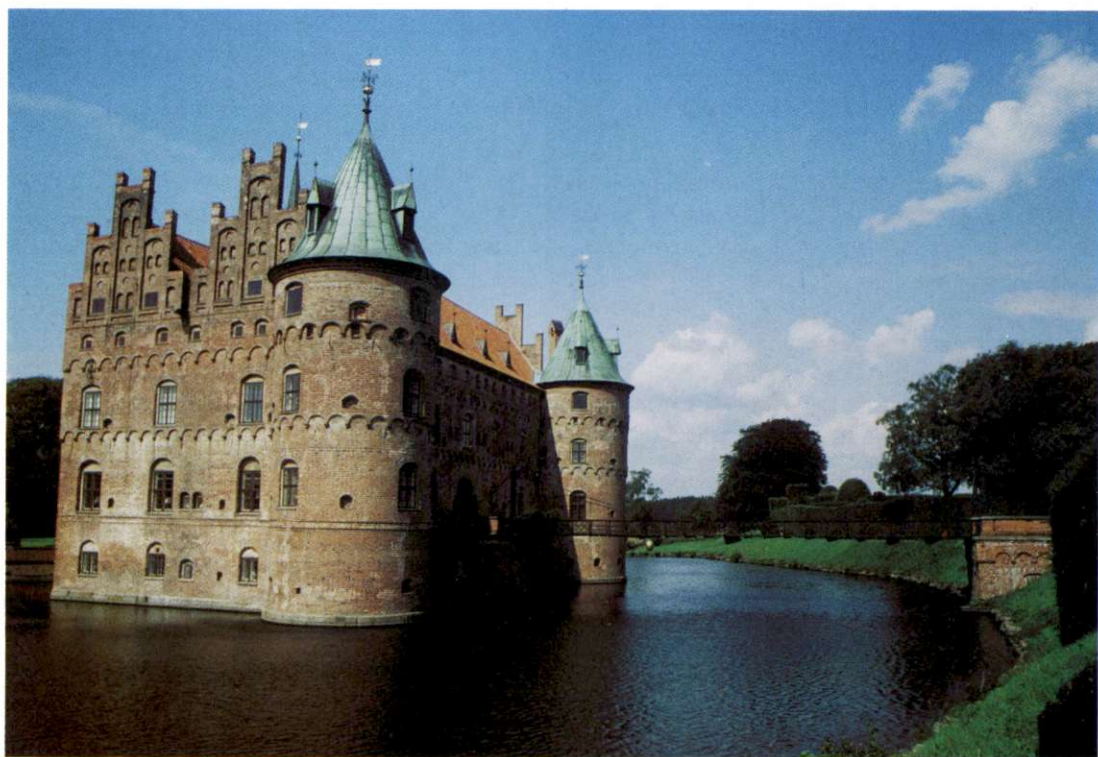
Slika 6: Na bogato in burno zgodovino opozarjajo številni lepo ohranjeni in vzdrževani gradovi. Eden izmed njih je Egeskov, zgrajen v 16. stoletju v južnem delu otoka Fyn. Iz obrambnih razlogov je bil postavljen sredi jezerca.

Zahodna Jutlandija je geomorfološko posebna