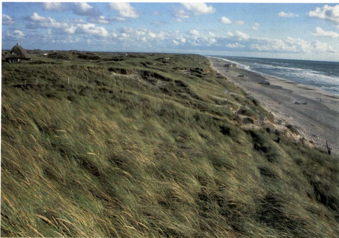
Slika 1: Zahodno obalo Jutlandije bičajo stalni zahodni vetrovi in močno valovanje. Zaradi mehkih, slabo sprijetih peskov morje obalo hitro spodkopava, zato so nemški bunkerji, ki so med 2. svetovno vojno stali vrh sipin, danes že skoraj zaliti z vodo. Za sipinami, poraslimi s travo, je naselje počitniških hiš.

The article represents natural and the newest social and economical features of southernmost scandinavian country. Special emphasize was put on presentation of contemporary development, based on intermingling of traditionalism and up-to-date technological knowledge, whose final goal is to assure healthy, pleasant and attractive human environment.