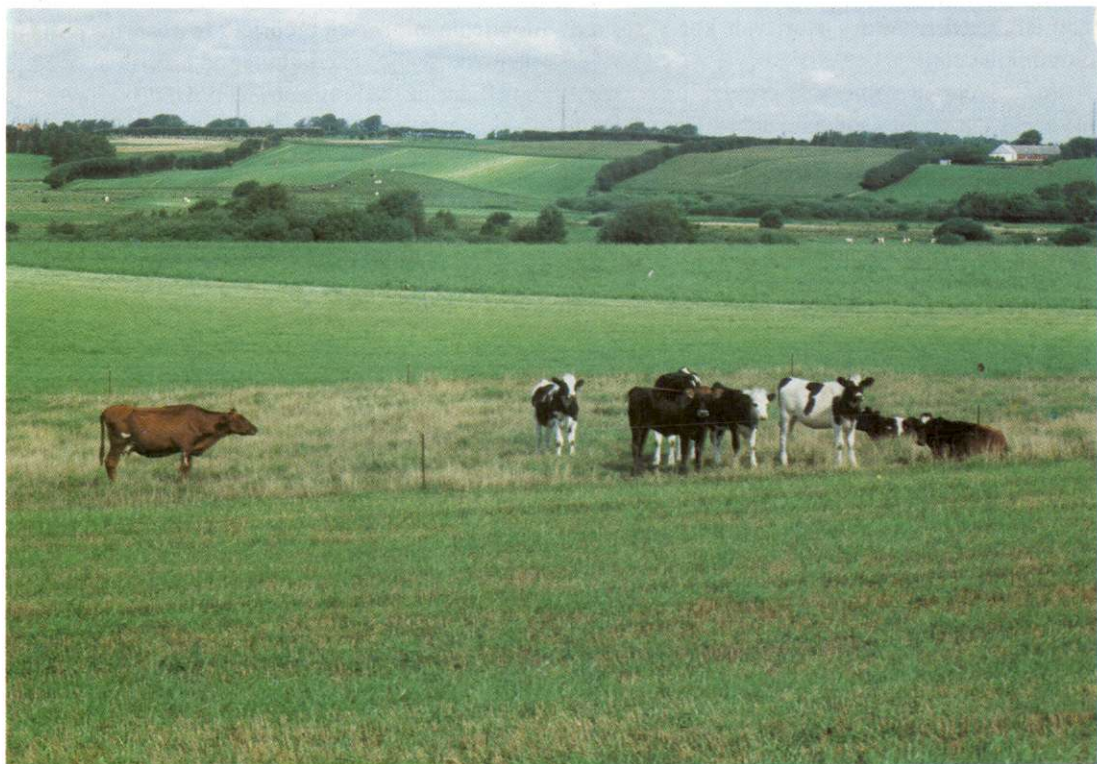
Slika 3: Polotok Jutlandija je prevladujoče usmerjen v mlečno živinorejo, zato je na poljih največ krmnih rastlin in ječmena. Proti neugodnim učinkom stalnih zahodnih vetrov se borijo s sajenjem vetrozaščitnih pasov na parcelnih mejah.

Najgosteje je poseljena vzhodna obala Zelandije, kjer je tudi urbana aglomeracija glavnega mesta København z dobro četrtino vsega prebivalstva v državi. Gosto sta naseljena tudi otok Fyn in vzhodna obala Jutlandije. Mestnega prebivalstva je kar okrog 85 % (7). Vsa stara mesta so ob obalah, saj je morje že od nekdaj pomemben vir prehranjevanja in trgovsko (nekoč tudi plenilsko) okno v svet. Nova srednje velika mestna središča so se v obdobju po industrijski revoluciji razvila tudi v notranjosti. Le štiri mesta imajo več kot 100 000 prebivalcev: København, Århus, Odense in Ålborg. Danska sodi med dežele z najvišjim življenjskim standardom. Njeni državljani uživajo številne socialne ugodnosti in imajo na voljo izjemno sodoben in učinkovit šolski sistem. Ljudje se lahko na stroške države izobražujejo tudi v zrelih letih, še posebno, če je za njih potrebna poklicna prekvalifikacija, kar pa ni nujen pogoj. Zelo dobre so tudi razmere in zaščita