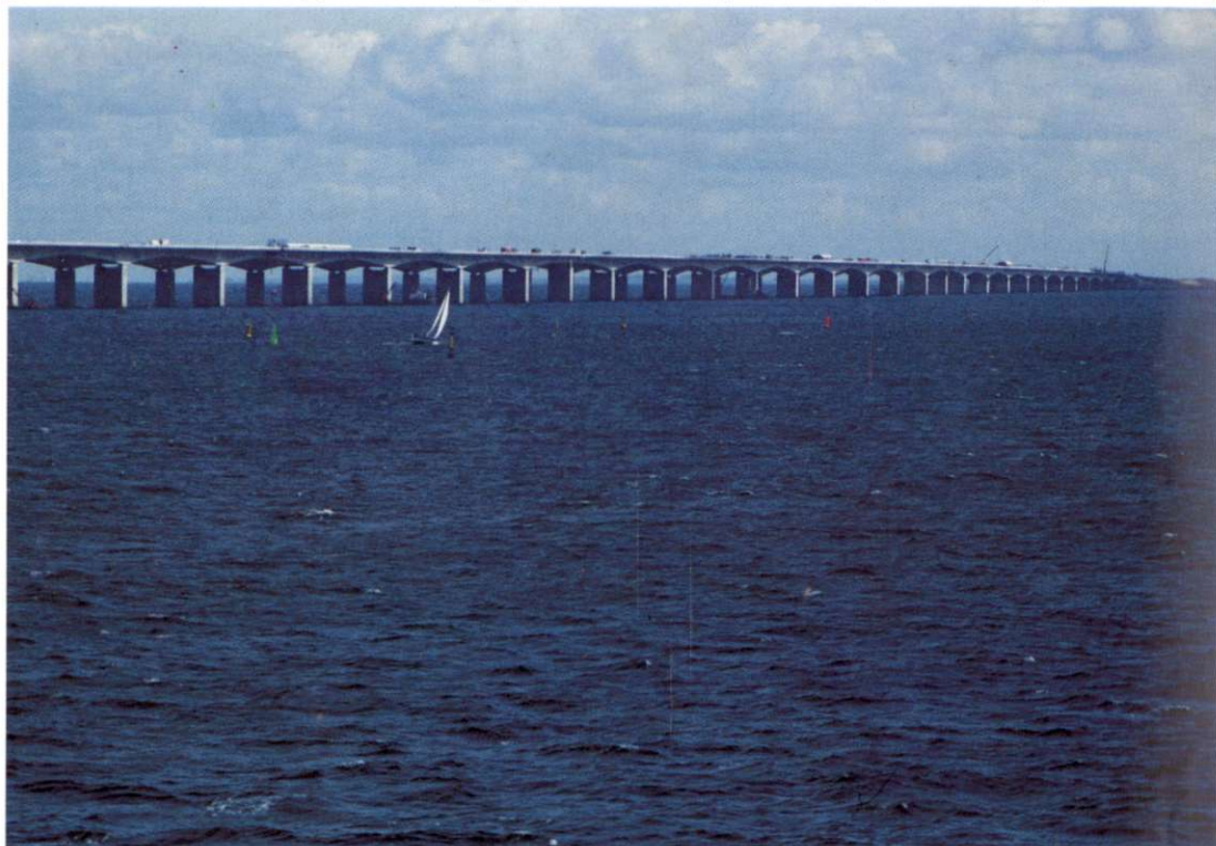
Slika 4: Kljub izredno dobrim trajektnim povezavam med otoki, si zaradi hitrejšega in lažjega pretakanja blaga in ljudi na najbolj prometnih poteh prizadevajo zgraditi mostove. Trenutno najdaljšega, dolgega 17 km, gradijo med otokoma Fyn in Zelandijo. Speljan je preko manjšega otočka v ozadju.

Danska rudna bogatstva so revna. Izkoriščajo samo granit v kamnolomih na otoku Bornholmu, kredo za pridobivanje kaolina in glino za potrebe keramične industrije (1). Boljše so, predvsem v najnovejšem obdobju, razmere na področju energetike. Leta 1972 so v Severnem morju odkrili precej bogata nahajališča nafte in leta 1984 tudi zemeljskega plina, ki so omogočila dokajšnje znižanje odvisnosti tega pomembnega gospodarskega dejavnika od uvoženih surovin. Glavni rafineriji sta v mestu Frederika na vzhodni obali Jutlandije, ob mostu na otok Fyn ter pri mestu Skælskør na jugozahodu Zelandije (2). Kljub temu si država načrtno prizadeva uvajati izkoriščanje alternativnih,