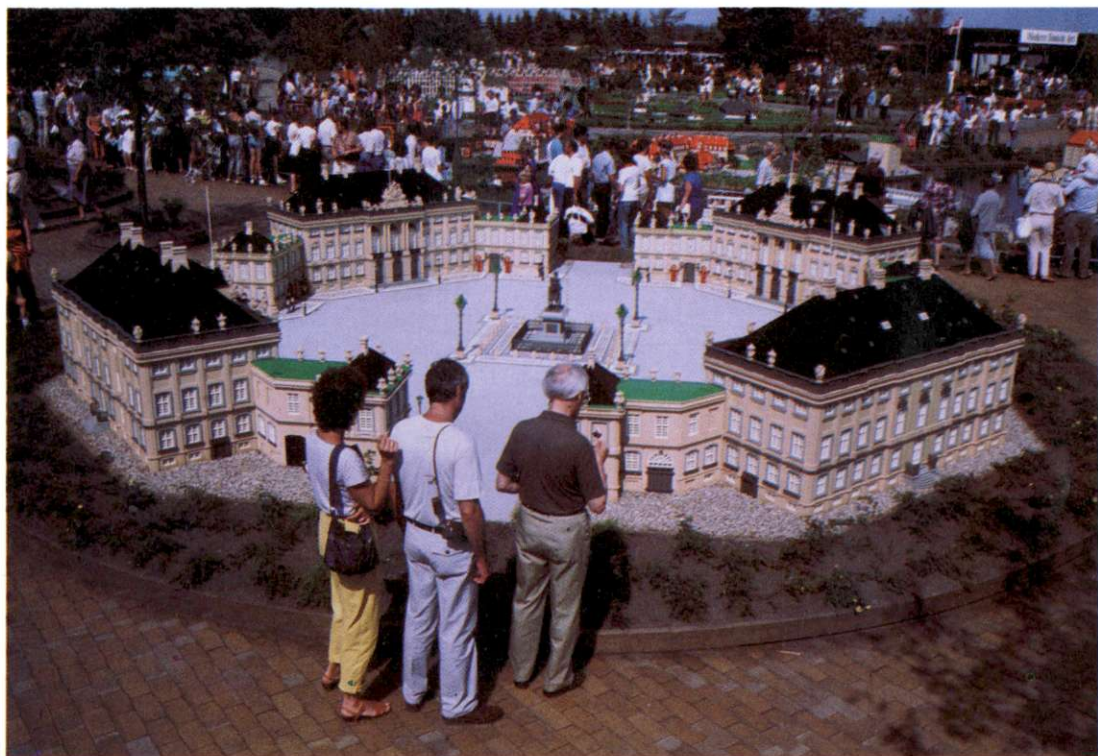
Slika 5: Danska izjemno lepo skrbi za ljudi in še zlasti za otroke. Vsepovsod je mogoče najti urejena in privlačna otroška zabavišča. Med njimi izstopa Legoland s pravljичno deželo iz plastičnih kock, ki leži v Billundu v osrčju Jutlandije, nedaleč od matične tovarne. Na posnetku je v ospredju kopija kraljevskega gradu Amalienborg iz Københavna.

Omrežji cest in železnic sta sodobni, gosti in zmogljivi. Številni mostovi ter ne predrage trajektne povezave omogočajo dostop do prav vseh naseljenih območij. Trajekti so različnih velikosti, odvisno od gostote prometa. Zanje in za druge ladje so prilagojeni mostovi, ki so bodisi viseči bodisi dvižni, tako da omogočajo nemoteno ladijsko križarjenje po najkrajših poteh. Pomemben je tudi zračni pro-