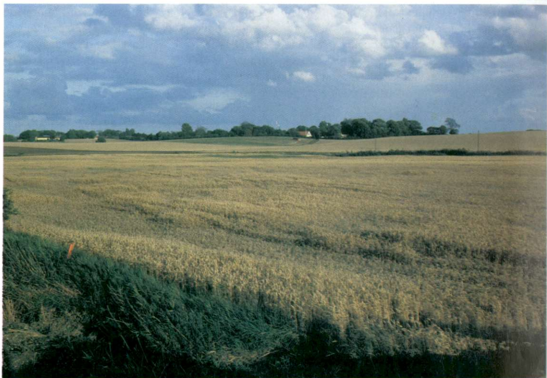
Slika 2: Sodobno poljedelstvo zahteva veliko, zaokroženo posest. Zato na danskem podeželju prevladujejo samotne kmetije, ki posedujejo večino obdelovalnih zemljišč. V bolj sušnem delu na vzhodu je prevladujoča usmeritev v pridelavo žit. Prizor je z otoka Fyn.

Danska je izrazito prehodno območje, ki ne predstavlja le naravne vezi preostalih skandinavskih držav z Evropo, temveč tudi pomembno prometno in gospodarsko povezavo. Leta 1973 se je kot prva in doslej edina država na severu Evrope vključila v takratno Evropsko gospodarsko skupnost, že v začetku leta 1995 pa naj bi se ji v sedanji Evropski uniji kot polnopravne članice pridružile tudi Švedska, Norveška in Finska. Med Dansko in Švedsko so predvsem na najožjem delu med Helsingoerjem in Helsinborgom tudi zelo pogoste, dobro orga-