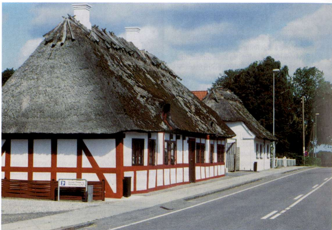
Slika 9: Prizor z obrobja mesta Odense na otoku Fyn razkriva izjemen občutek Dancev za ohranjanje tradicionalnih prvin bivalnega okolja. Na videz majhne stanovanjske hiše se tako v mestih kot na podeželju stapljajo s pokrajinskimi značilnostmi. Slamnate strešne kritine so še vedno dokaj pogoste in čedalje bolj priljubljene.

7. Natek, K., Perko, D., Huzjan Žalik, M. 1993: Države sveta 1993. Državna založba Slovenije, Ljubljana.