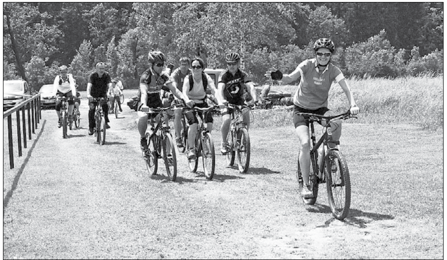
Udeležence so povabili na vodeno kolesarjenje po Sončni poti in voden pohod po Čebelarski poti.