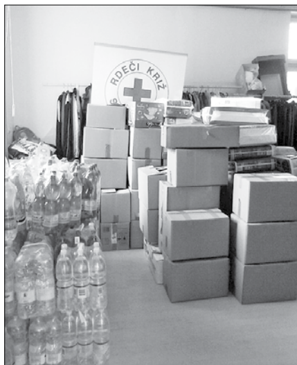
Zbrano blago so v skladišču Rdečega križa v Mozirju sortirali in pripravili za odvoz.

Pomoč se je zbirala po občinah, pri posameznikih, pri raznih organizacijah, pri zbiranju so pomagali gasilci, prostovoljci in člani raznih društev. Pri Karitas so sami organizirali zbiranje hrane in ostalih potrebščin v trgovinah Hofer, njihovi prostovoljci pa so se vključevali pri zbiranju pomoči po vseh občinah. Vsa zbrana pomoč se je potem sortirala, dva avtoprevoznika pa sta se odzvala na prošnjo za brezplačen prevoz blaga v Ljubljano. Tam je blago prevzela humanitarna organizacija ADRA, ki bo poskrbela za prevoz na poplavljen območje.