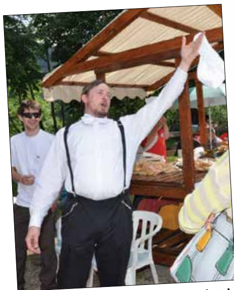
Kuharska ekipa KD Mozirje je bila sestavljena iz igralcev zadnje igre Vaja zbora.

Tekst: Benjamin Kanjir