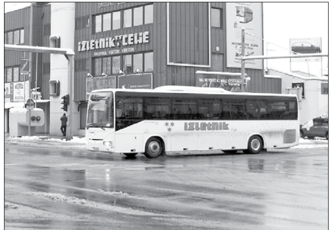
Težave s subvencioniranjem javnega avtobusnega prevoza imajo tudi avtoprevozniki.

Po prvotnih grožnjah o ukinitvi subvencioniranih prevozov je vlada konec maja sprejela odločitev, da bo s prerazporeditvami znotraj ministrstva za infrastrukturo in prostor zagotovila zadosten obseg pravic porabe za sklenitev aneksov za opravljanje linijskih avtobusnih prevozov za meseca maj in junij 2014. S tem se je sprostila