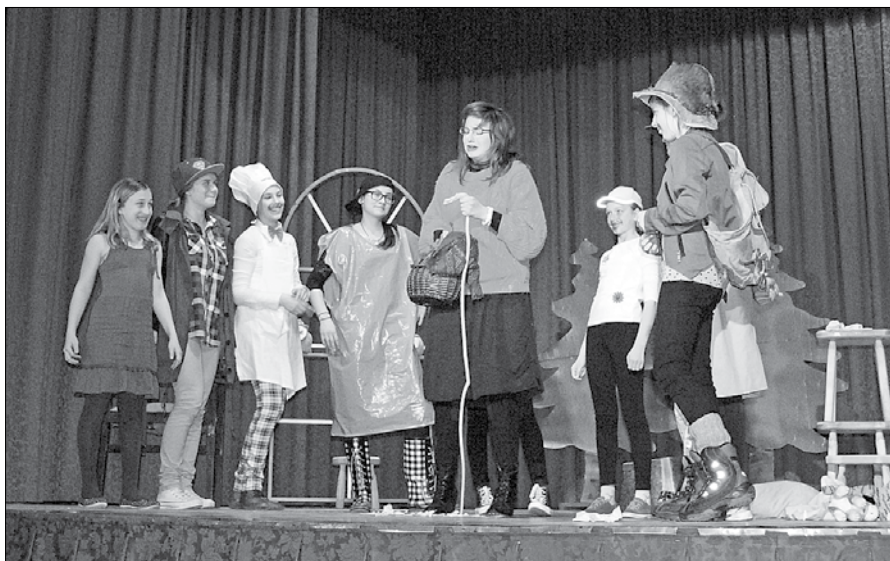
Sneguljica je tudi v moderni izvedbi v družbi sedmih palčkov ugnala zlobno mačeho.