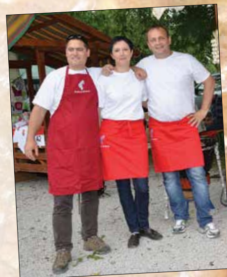
Člani ekipe F10 so skuhalu drugi najboljši golaž.