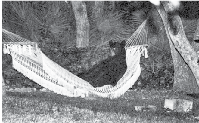
Lučki medved si je našel svoj prostor pod soncem.

Jaz jem vsem od kraja. In če mi hočete pridigati glede tega, naj vam jasno ponovim: jaz jem vse od kraja.