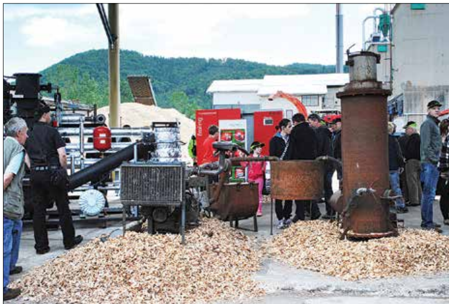
Obiskovalci so si lahko ogledali tako nove kotle kot predhodnico moderne kogeneracije na lesni plin.