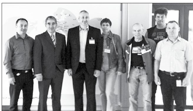
Vodstvo podjetja BSH Hišni aparati Nazarje z gasilskim vodstvom

dal: »Namen tega obiska je bil, da bi se odgovorni v podjetju BSH, ki skrbijo za požarno varnost, z GZS in GZ ZSD dogovorili o čim boljšem sodelovanju pri izobraževanju in usposabljanju zaposlenih, ki so vključeni v gasilsko enoto v podjetju BSH, poleg tega pa so tudi člani operativnih enot v matič-