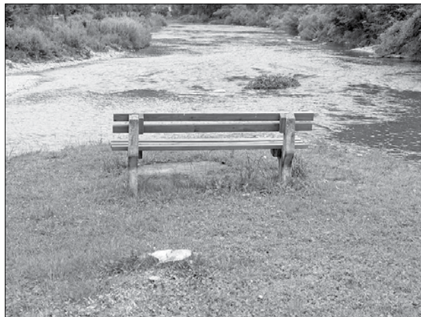
Lipa, ki je končala v sotočju Drete in Savinje, ...