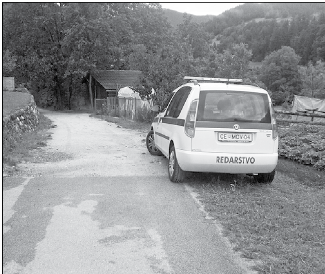
Nadzor, ki se je opravljal na območju občine Ljubno, je bil nadzor na poti ob Ljubnici zaradi problematike vodnikov psov in ne zaradi mirujočega prometa.

VO). Zmotilo ga je parkiranje redarjev na zelenico in pot, torej neoznačeno parkirno mesto, medtem ko sami iščejo ravno takšne prekrškarje. Dodal je še, da je parkiran avtomobil »varuhov reda« lep zgled za občane. Sam se je obrnil na MIRVO in od vodje Sonje Glažer dobil sledeči odgovor: »Zakon o pravilih cestnega prometa v 103. členu določa, da sme redar redarsko vozilo parkirati na cesti toliko časa, kot je potrebno za opravljanje njegovih nalog.«