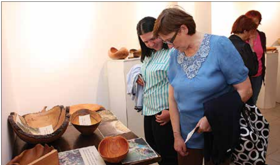
Sklede, ki so narejene iz solčavskega lesa, so si obiskovalci z zanimanjem ogledali.