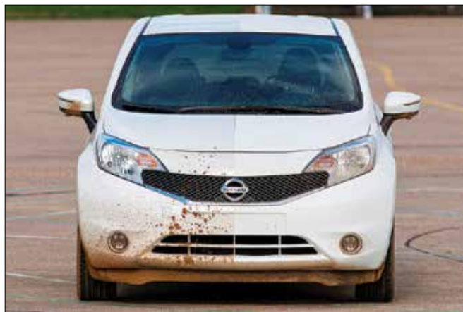
Nissan testira inovativno tehnologijo barve, ki odbija blato, dež in vsakdanjo umazanijo. (Fotodokumentacija Nissan)

Doslej se je premaz, ki ga trži in prodaja podjetje UltraTech International, dobro izkazal v običajnih situacijah, kot so dež, pršenje, zmrzal, sodra in stoječa voda. Čeprav trenutno še ni načrtov, da bi tehnologijo pri omenjenem mode-