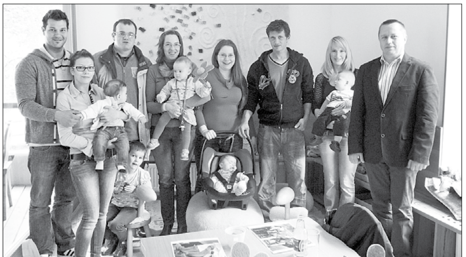
S sproščenega srečanja pri županu