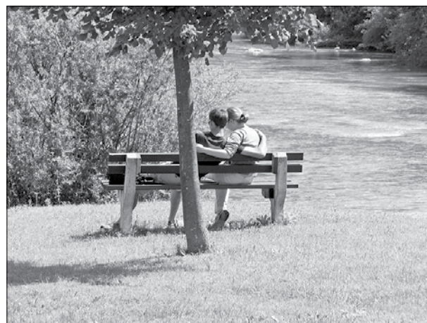
... je leta dajala senco obiskovalcem gradu Vrbovec.