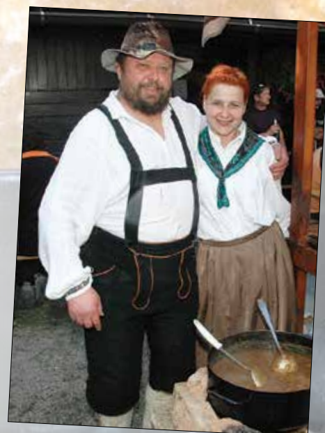
Tudi ekipa okrepčevalnice Rebrca se je preizkusila v kuhanju golaža.