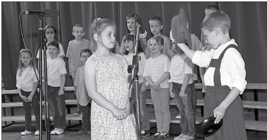
»Stara mati, dober den, mate kaj za krpati?« so spraševali v otroškem pevskem zboru Cici iz lučkega vrtca.