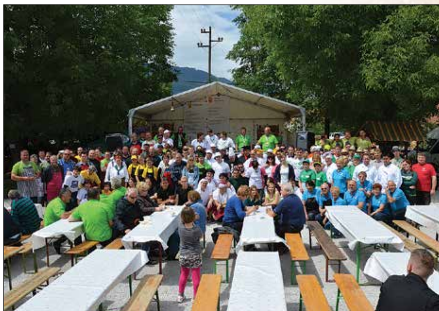
Pred začetkom kuhanja so se sodelujoči postavili pred fotografski objektivi.