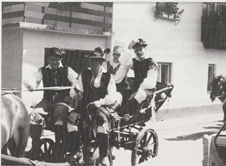
Prizor s kmečke ohceti v Bohinju

In tako smo začeli z obredom cerkvene poroke. Glavni obracun je bil pri pridigi poročne maše: ”Draga ženin in nevesta, dragi svatje in vsi ljudje dobre volje, ki me poslušate! Stojimo na posvečenem zgodovinskem kraju, kjer so v davnini prvi misijonarji krščevali naše pobožne prednike. Po 50. letih zopet pogumno vodimo svatovski sprevod naše kmečke ohceti po stari šegi v nam ljubo cerkev sv. Janeza Krstnika ob jezeru. Upam, da smo s tem dokončno premagali naše komplekse verske strahopetnosti. Ob tej priliki se sramoto spominjamo tukajšnjega praznovanja 200 - obletnice prvopristopnikov na Triglav, ki se je odvijalo pred 16. leti. Takrat so vsi mediji peli hvalo mnogim ljudem, našega zaslužnega Jakoba Aljaža pa so se komaj spomnili. Pozabili so tudi na