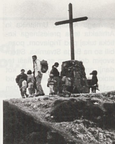
Pri križu na vrhu Svetih Višarij

Razkoli in zmote so odraz dobe, v kateri nastajajo. Razvijejo se lahko zaradi različnih narodnih, političnih in družbenih napačnosti, ki vladajo med narodi in civilizacijami. Nanje velikokrat vplivajo razne osebne značilnosti vpletenih v spore (rivalstvo, ošabnost, samopotrjevanje...). Povzročitelje velikih razkolov je velikokrat vodilo zmotno prepričanje,