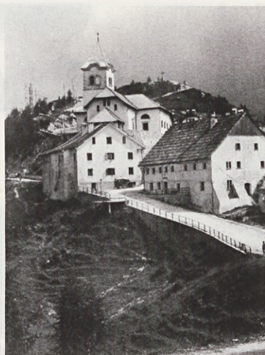
Marijino svetišče na Svetih Višarjah

Odbor za Mednarodno leto družine je v Stični pripravil celodnevno slovesnost. Udeležili so se je predstavniki Svetega sedeža, slovenski škofje in zastopniki civilne oblasti; vseh udeležencev je bilo 1500. Zbranim na notranjem samostanskem dvorišču so govorniki prikazali pomen družine za človeško družbo, kaj je bilo storjenega zanjo v letu družine in kaj bi kazalo še narediti.