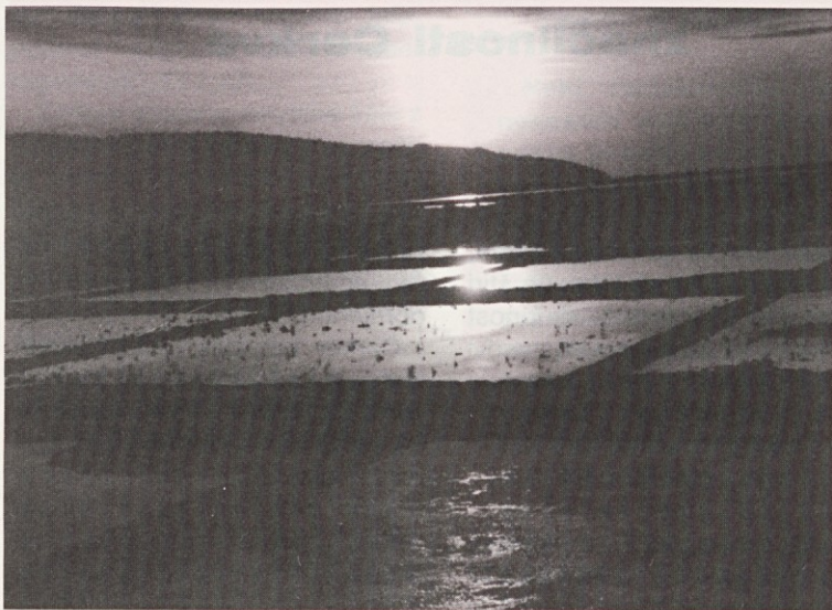
Sončni zahod v sečoveljskih solinah

V prelestnem čaru božje narave se klanjamo dostojanstveni lepoti naše dolske narodne noše, v kateri nastopata današnja mladoporočenca. Občudujemo lepotni okus našega ljudstva, ki je estetsko oblikovalo eno najlepših narodnih noš v Evropi. S še globljim pogledom se zazrimo v naš 'zauber' poročni par in zaslutili bomo neko posebno duhovno lepoto. Zdita se kot dragocena ikona, sveta podoba idealne zakonske zveze. Spominjata nas na 'praslutnjo, ki ne vara', na globoko željo, zapisano v naših srcih, željo po uresničitvi prvotne božje zamisli idealne ljubezni med možem in ženo. Dragi prijatelji, mi kristjani smo prepričani, da je ljubezen med možem in ženo prav poseben božji dar, nekaj svetega in podarjenega... Kot pred strupeno kačo zbežimo pred raznimi življenjskimi zablodami, ki so danes tako zelo priljubljene: ločiti kar je Bog združil; namer-